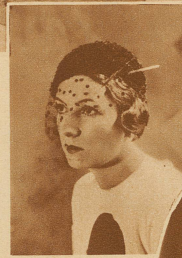
Gefahr in Sicht! - Die Hutnadel taucht wieder auf

Broderie anglaise, dient als Uebergang vom Satinkleid zum Chiffonabschluß. Pailletten-Umhang, mit Samt abgefüllt