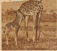
Giraffe mit Jungem

Wer einmal den Zauber Afrikas, seiner herrlichen Landschaft und seiner kindlich-naiven und gutmütigen Urbevölkerung erfahren will, den zieht es mit Macht immer wieder dorthin. Mühselig und geschwind entfallen wir mit Hilfe des Flugzeuges unserer überstiegenen Zivilisation, um in Schwarzem Erdteil uns an der Ursprünglichkeit, an der Unberührtheit von Menschen und Erde zu begreifen. Eigentlich ein grosser Gegensatz, in welchem der große Reiz meiner Afrikaflüge gerade liegt. — Wo Eisenbahn und Auto heute hinkommen, da findet der Afrikareisende wohl alle Bequemlichkeiten der Zivilisation, die nirgends so geschätzt wird, wie gerade in diesen beiden, zum Teil ungesunden Gegenden. Aber hier hat das ursprüngliche Afrika, wie es aus den Büchern der großen Afrikaforscher des letzten Jahrhunderts entgegentritt, einer hohen Kultur weichen müssen. Nur lange, beschwerliche Reisen oder dann das flinke Flugzeug führen uns in das Innere, wo das Afrika zu Zeiten eines Livingstone, Stanley und Schweinfurth noch heute uns in ursprünglicher Form entgegentritt. — Solchen nur wenig berührten Gegenden gilt mein dritter Afrikaflug, der im Auftrag eines Amerikaners Anfang De-