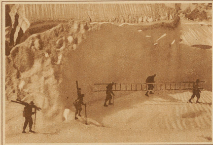
Um die Spalten besser überschreiten zu können, tragen die Führer eine Leiter mit