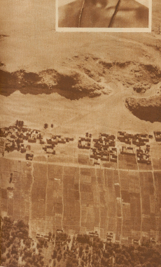
Ein Bild eines Piloten, der eine Expedition führt. Die Expedition wird von Zett zu Zett weitergeführt, so daß schließlich Bergsteiger, Narben entstehen.