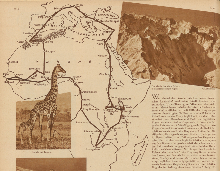
Das Massiv der Mont Pelvoux in den französischen Alpen