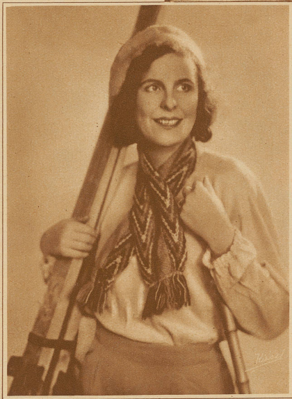
Leni Riefenstahl, Hauptdarstellerin und einzige im Montblanc-Film mitwirkende Frau