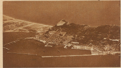
Festung und Häfen von Gibraltar