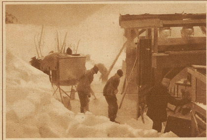
Um auch die Atelieraufnahmen möglichst echt zu bekommen, wurde eine Nachbildung des Innenraums des Montblancobservatoriums auf dem Berninapass erstellt, wo elektrischer Strom zur Verfügung stand

meist nicht einmal angeseilt. Andauernd stürzen Lawinen und Eisblöcke in fast gleichmäßigem Rhythmus herunter. Ueber die Gefahren des wochenlangen Filmens dort oben schreibt der Regisseur Dr. Fanck: «Das unheimlichste Element war nicht die Felswand, nicht die Eiswand, nicht einmal der Schneesturm, nicht die Lawine, sondern die Gletscherspalte.» Ihm selbst widerfuhr es einmal, daß er in einer Spalte einbrach und von den Führern aus 20 Meter Tiefe heraufgeholt werden mußte.