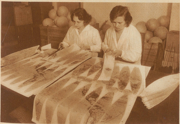
Die bunte Erdrinde, auf der alle Länder und Meere zu sehen sind, wird aus Papier zurechtgeschnitten, damit sie nachher schön auf den Globus paßt