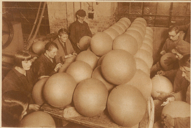
Die Kartonkugeln werden glatt und sauber poliert