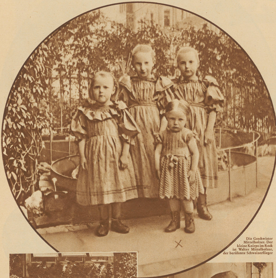
Die Geschwister Mittelholzer. Der kleine Knirps im Rock ist Walter Mittelholzer, der berühmte Schweizerflieger