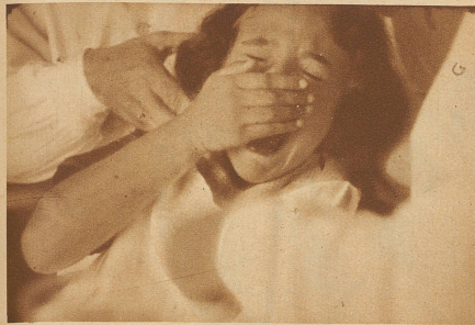
Ou, nein, nein — ich will nicht, es tut weh. «Willst du lieber immer Zahnschmerzen haben und so grässlich faule Stummel im Mund?»