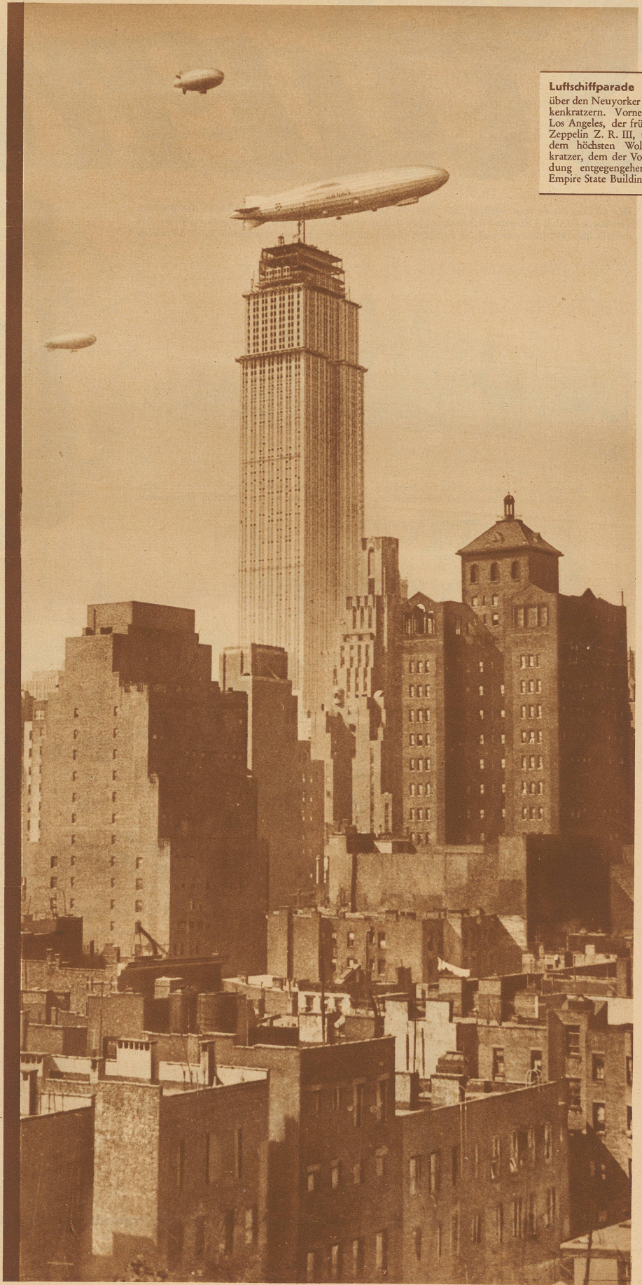
Luftschiffparade über den Neuyorker Wolkenkratzen. Vorne die Los Angeles, der frühere Zeppelin Z. R. III, über dem höchsten Wolkenkratzer, dem der Vollendung entgegengehenden Empire State Building