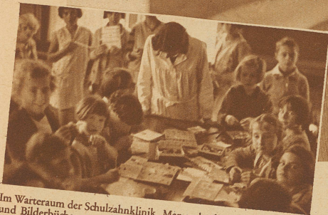
Im Warteraum der Schulzahnklinik. Man sucht die Kinder durch Spiele und Bilderbücher von ihren ängstlichen Vorstellungen zu befreien

Nur fest den Mund auf. Noch mehr - so! Keine Angst, es surrt nur ein wenig. Wenn's weh tut, hör ich sofort wieder auf