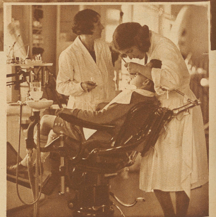
Das Aergste ist überstanden. Es sah alles schlimmer aus, als es eigentlich war. Nun drückt das Fräulein noch die Füllung in den ausgehöhlten Zahn. Der Franz hält nicht ungerne still

Nur fest den Mund auf. Noch mehr - so! Keine Angst, es surrt nur ein wenig. Wenn's weh tut, hör ich sofort wieder auf