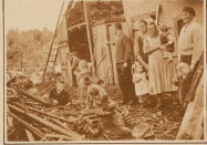
Vor dem Haus der Familie Roth in Hünzle-Riedholz, auf die 13 Tannen geworfen wurden. Die acht schließenden Kinder konnten nur durch ein Fenster gerettet werden.