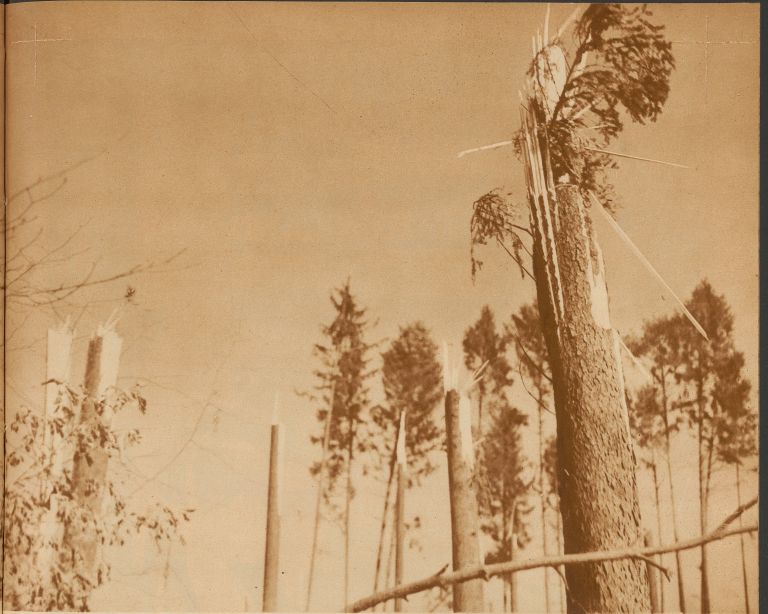
Die meisten Tannen wurden in halber Höhe geknickt. Der Wald sieht aus, wie wenn er durch ein Granatfeuer verwüdet worden wäre.