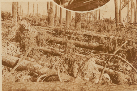
Meterhoch bedecken die umgeworfenen Tannen den Boden.