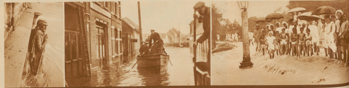
Hochwasser der Seine in Paris. Der populäre Zaun an der Alibiabridge reißt bis zu den Knien im Wasser - doch er verliert seine Ruhe nicht.