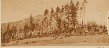
Der vom Sturm geknickte Wald von Riedholz. Nur einige wenige Tannen sind anstehengeblieben.

Der Orkan, der vorigen Sonntag früh über die Schweiz hinfegte, hat hauptsächlich in den Wäldern von Riedholz und Athisholz bei Solothurn gewaltigen Schaden angerichtet. Das verbrüdete Waldgebiet umfaßt über 150 Judkaren und der daraus resultierende Schaden beträgt mindestens 30000 Franken. (Von Marie)