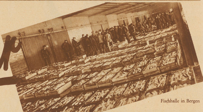
Fischhalle in Bergen

daran das nördliche Eismeer so überaus reich ist. Kommt man ein wenig später, so zu Ende April etwa, in diese Gegenden, dann hat man Gelegenheit, dieses «Gold Norwegens» in nie geahnten Massen längs der weitverzweigten Küste angehäuft zu sehen. Wohin das Auge blickt, Fische, Fische und immer wieder