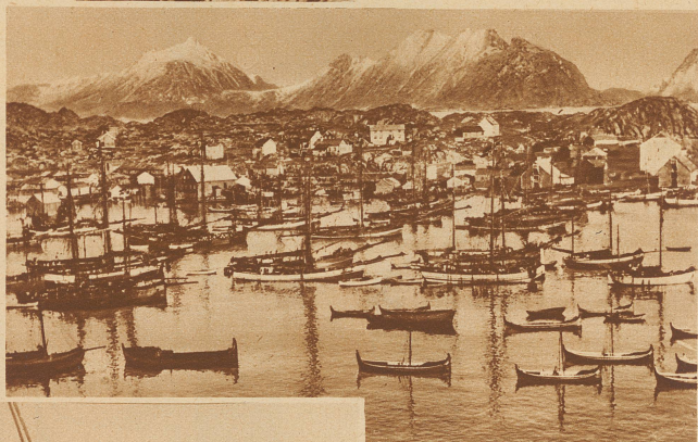
In Bolstad versammelt sich die Lofotenflotte, bestehend aus Fahrzeugen der ganzen norwegischen Küste, um in die Eismergewässer zum Fang auszuziehen