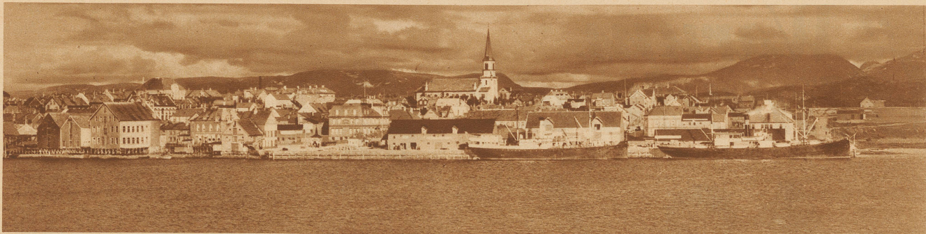
Bodo, ein Städtchen an der nord-norwegischen Küste, der Schauplatz des Lofoten-Fischfangs