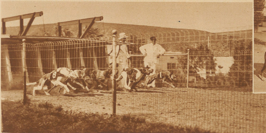
Der Sieger mit seinem schmunzelnden Wärter