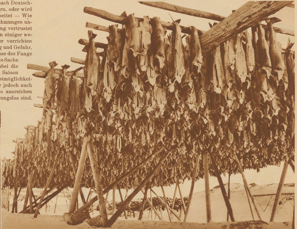
Millionen von Stockfischen hängen längs der Küste an solchen Gestellen. In trockenem Zustand werden sie dann hauptsächlich nach China, Rußland und Südafrika exportiert