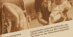
Ungewöhnlich quieschendes, trübendes, zappelndes Leben, erdet aus allen Quartieren der Stadt zu den Mütterberatungsstellen