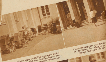
Schwere Kistenwagen und halbe Sperrwagen bilden den Hauptpark im Hof einer Gemeindefabrik, aus deren Räume die Mütterberatungsstelle beherbergt

Säuglingskinder allein 14 Mütterberatungsstellen eingerichtet. Hier überwacht der Kinderarzt mit liebevollem Eingehen die Ernährung. Die Mütter wird zur pünktlichen Pflichterfüllung und Beobachtung aller Lebensbedingungen des kleinen Menschen erzogen. Be-