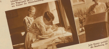
Die Aerstin untersucht das Kind, während die Mutter in zärtlicher Sorge