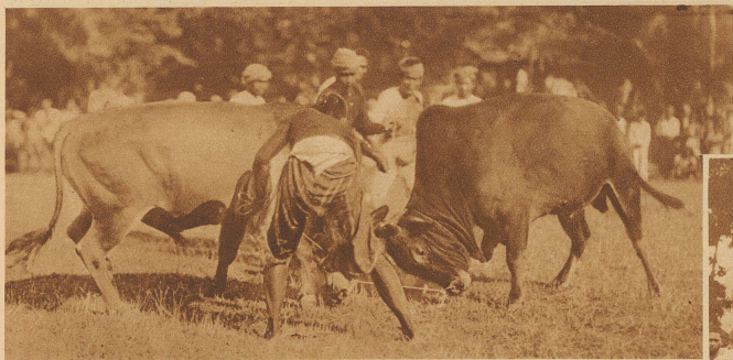
Zwei kämpfende Stiere. Auf den Sieg des schwarzen hatte der Sultan 1000 Pesos gewettet — und verlor

ger Mann mit einem roten Fez auf dem Kopfe und einem Spazierstock in der Hand. Jetzt konnten die Kämpfe beginnen. Zwei mächtige Stiere wurden an Nasenringen in die Mitte der Arena geführt. Der eine braun, der andere schwarz. Auf den Sieg des Schwarzen hatte der Sultan 1000 Pesos gesetzt. Kaum hatten die Tiere sich gegenseitig erblickt, senkten sie ihre Köpfe und sprengten mit ungeheurer Wucht aufeinander los. Es gab einen widerwärtigen, dumpfen Schlag, als ihre Schädel zusammenkrachten und man glaubte, die Knochen und Muskeln auseinandergesprengt zu sehen. Wolken von Staub wurden von den wütend brüllenden Tieren aufgewirbelt. Das Volk raste vor Vergnügen und Erregung. Bald hatte der schwarze Stier die Oberhand, bald wieder der braune. Dann plötzlich, sehr zum Aerger für alle diejenigen, die auf ihn gewettet hatten, brach der schwarze den aussichtslosen Kampf ab, wendete sich