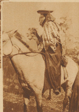
Die Lieblingsfrau des Sultans kommt hoch zu Pferd zu den Stierkämpfen

Die den Frauen und Kindern reservierte Tribüne, die rings um den Kampfplatz führt. Gerade bequem sind die Sitze auf den Bambusstangen nicht