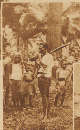
Ein Moro-Polizist mit geschultertem Gewehr