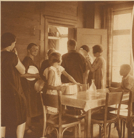
Die Gemeindestube im Friesenberg wird in der Mittagszeit zur Volksküche. Es gibt viele Familien, die das Essen aus der Volksküche beziehen. Es kommt sie billiger zu stehen, als wenn sie selber kochen