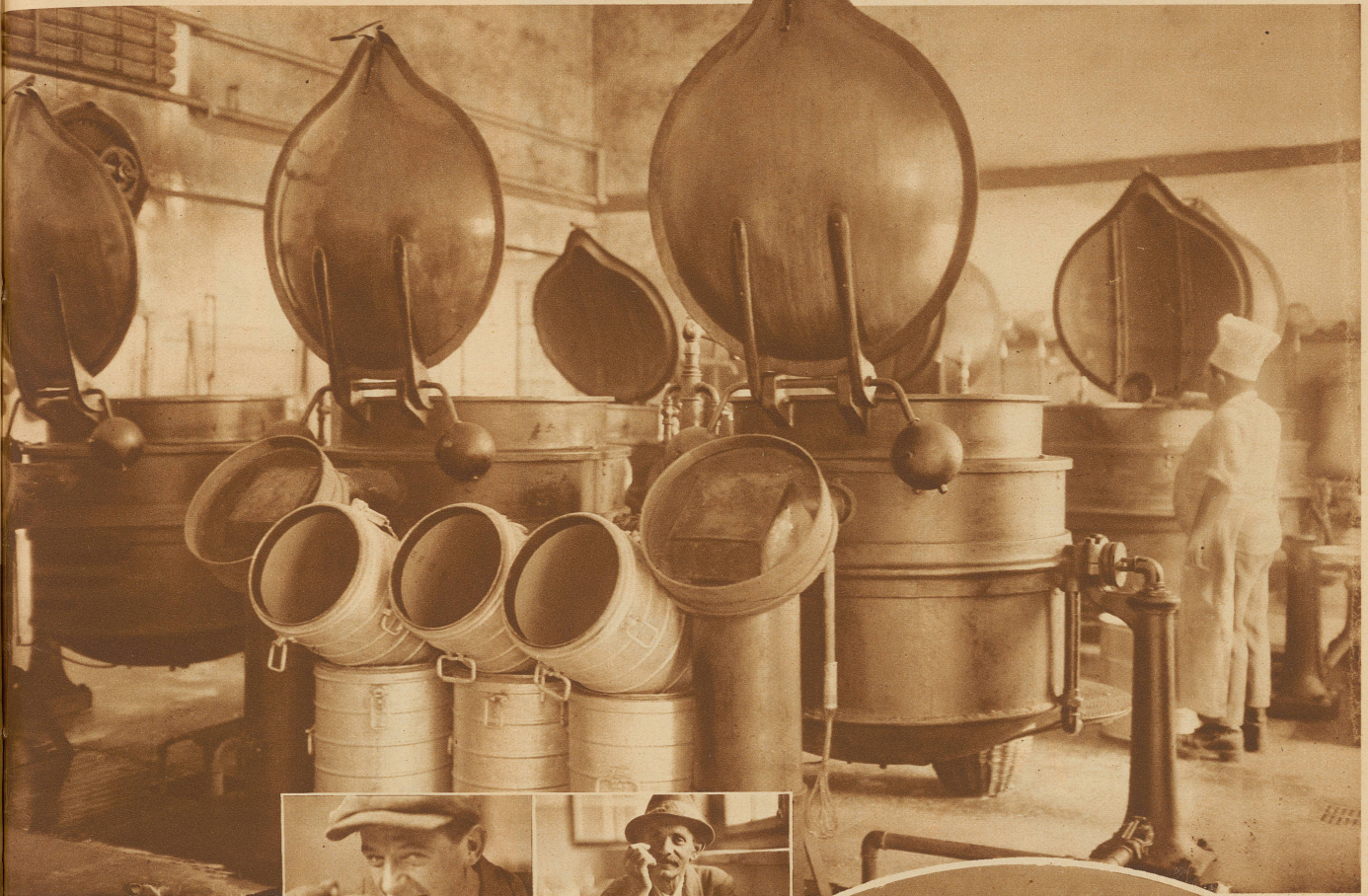
In neun mächtigen Kesseln zu 400 Liter Inhalt wird täglich das Mittagessen für mindestens 2000 Personen gekocht, in Thermophore gefüllt und durch Lastautos in die verschiedenen Speiselokale in allen Quartieren der Stadt geführt