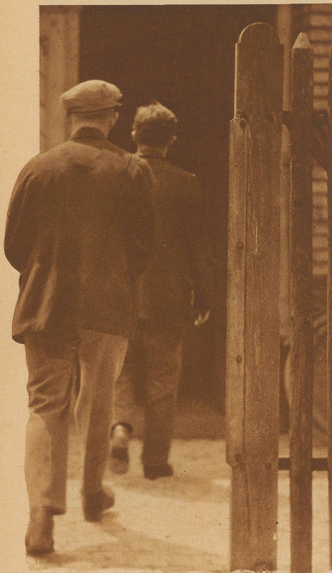
150-160 Arbeiter benutzen täglich die Städtische Volksküche an der Fabrikstraße. Das Lokal genügt den Anforderungen nicht mehr. Der Bau eines neuen Volksküchengebäudes ist geplant