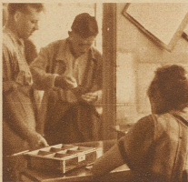
Bild links: An der Kasse einer Volksküche: Jeder Esser erhält für sein Geld einen Gutschein, sei es nur für Suppe, Gemüse oder Fleisch oder für ein ganzes Mittagessen