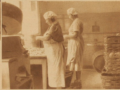
Während die Hausfrau daheim nur wegen einem kleinen Stück Zwiebel als würzende Beigabe Tränen vergießt, müssen sich die dienstbaren Geister der Städtischen Volksküche mit Bergen von Zwiebeln abfinden

Viele kommunale Institutionen, die der Fürsorge dienen, haben ihre Vorläufer in privaten Einrichtungen. Jahrzehntlang hatten gemeinnützige Organisationen in einzelnen Stadtteilen Suppenküchen eröffnet und betrieben. Zuerst wurde lediglich Suppe an Erwachsene abgegeben und später auch an bedürftige Schüler. Die Schulbehörden schenkten der Schülerspeisung ihre Aufmerksamkeit und errichteten in einzelnen Schulhäusern selber Küchen- und Speiselokale, die hauptsächlich während der Kriegszeit stark frequentiert wurden. Später übernahm die Volksküche die Schülerspeisung. Diese bot nun