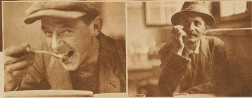
Im Jahre 1929 wurden 246 132 Liter Suppe, 162 251 Portionen Fleisch und 141105 Portionen Gemüse in der Städtischen Volksküche konsumiert, nahezu das doppelte Quantum gegen 1928