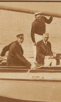
Der König von Dänemark fühlt sich am wohlsten auf dem Wasser und läßt sich als Teilnehmer einer Segelregatta fotografieren