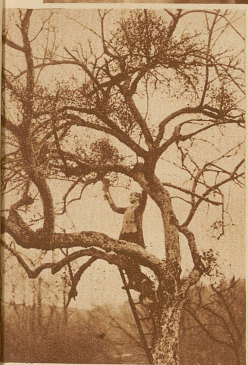
Sterbender Baum, von dem die Mischeln heruntergeschnitten werden