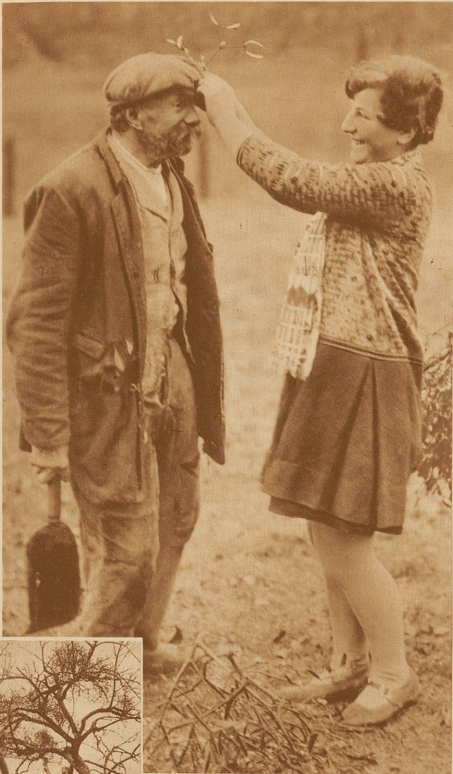
Zu Weihnachten wird die Mütze mit einem Mistelzweig geschmückt