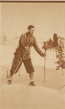
Der Kronprinz Umberto von Italien tummelt sich am liebsten auf dem, was seinem sonnigen Lande fehlt, dem Schnee, und produziert sich als gewiegter Skiläufer