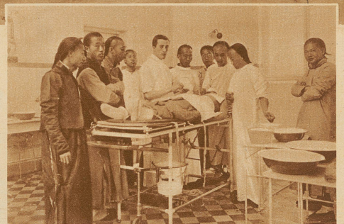
Operation in einem chinesischen Missionsspital. Eingeborene Aerzte, die von Missionaren ausgebildet wurden, sind als Assistenten tätig