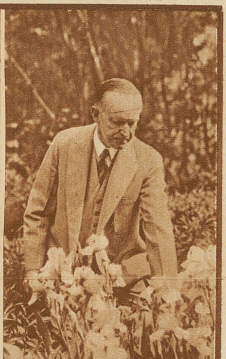
Der Expräsident der Vereinigten Staaten von Nordamerika, Calvin Coolidge, ist ein großer Blumenfreund. Mit Interesse betrachtet er die Blumenanlagen seines Gartens