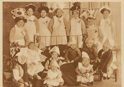
Weihnachten im Missionsspital Shanghai. In der ganzen Welt werden Geschenke gesammelt, um damit die kleinen Eingeborenenkinder zu beglücken

für die Eingeborenen. — Wer fragt hier noch, warum die Missionare all das tun? Sie tun es! Daß die großen Staaten ihre Dienste zu eigennützligen Zwecken ausbeuten, das ist Sache der Staaten; das setzt aber nicht das große Verdienst der Missionare herab, sondern krönt sie eher mit dem Dornenkranz!