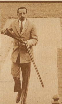
König Alfons von Spanien ist eifriger Schütze und erringt einen ersten Preis beim Taubenschießen