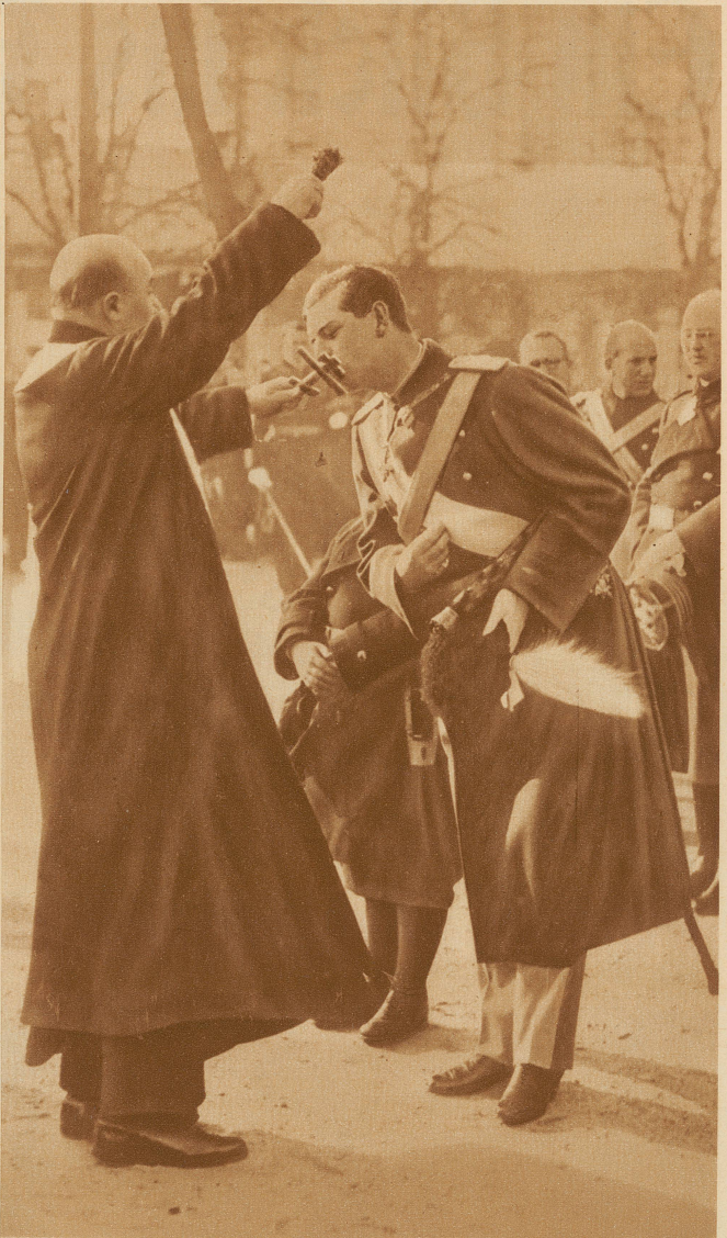
König Carol küßt das heilige Kreuz nach Ablegung des Fahneneides in der rumänischen Militärakademie