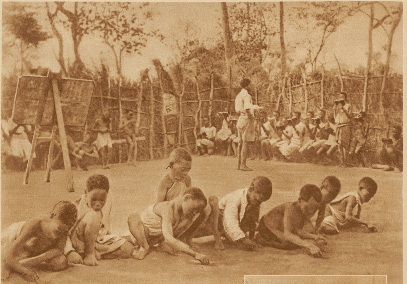
Der Negerjunge braucht weder Papier noch Feder, denn er übt das Abc im Sand mit den Fingern

nomische Beobachtungen, geographische Entdeckungen, sie holen das Geheimnis der Porzellanfabrikation nach Europa,