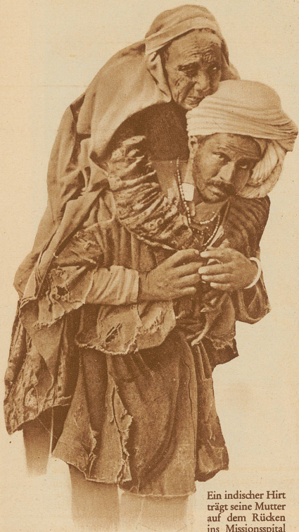
Ein indischer Hirt trägt seine Mutter auf dem Rücken ins Missionsspital

Noch größer sind ihre Leistungen auf medizinischem Gebiet. Krankheiten, in deren Nähe sich kein Europäer traut, wie Pest und Lepra, pflegt der Missionar mit aufopfernder Menschenliebe. Viele fallen als Opfer ihres Berufes. Die Jesuiten leiten 48 Spitäler, in denen 15 000 Kranke gepflegt werden. Die London Missionary Society hat in Papua ein Spital, wo 90 Kranke gepflegt werden können und wo im Jahre 1929 ca. 20 000 Konsultationen abgehalten wurden. Außerdem besitzen sie fünf große Schiffe, die aus Sammlungen in öffentlichen Schulen erbaut wurden. Diese fahren zu den Südsee-Inseln und bringen Medikamente, Nahrungsmittel, Heil und Trost