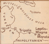
Leptis Magna liegt zwischen Tripoli und Misrata