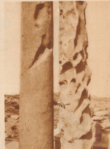
Zwei Steine, welche über die im Wüstensand verschollene Stadt hinausgingen, wurden im Laufe der Jahrhunderte durch die Sandstürme auf die Fremde hin geschleudert. Nicht minder ist dies eine der kunstvollen Steine am Palast des Kaisers Septimius Severus