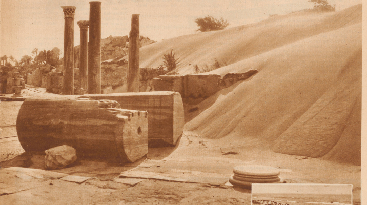
Die Ausgrabungen werden beständig vom Wüstensand bedroht

Wenn man die Ruinen des alten Karthago durchwandert, so ist man enttäuscht. Nur stange Gruppen von Säulenstümpfen, die gar keinen Eindruck von einstiger großer Vergangenheit übermitteln können. Hingegen hat der Archäologe dort allein vier Schichten von hoher kulturhistorischer Bedeutung gefunden. — Anders ist es in den weiter südlich gelegenen Städten der einst reichsten römischen Kolonie Nordafrika, in Tunis und Sädgerien, wo manches Bauwerk, in Trümmer sogar der