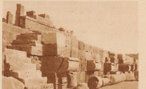
Die mit dem Sand ausgegrabene Hafenanlage. Man sieht die Treppe, die ins Wasser hinabführt, und die Vorposten, an denen die Schiffe befestigt wurden