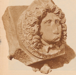
Fast täglich findet man bei den Ausgrabungen solche Kunstwerke

Man kann Leptis Magna mit Pompeji vergleichen. Was dort Ascheregen und Lava verschüttet und gleichzeitig wieder konserviert haben, brachten hier an Rand der Sahara die Sandstürme vieler Jahrhunderte fertig, welche heutzutage, aber unerhörtlich das weite Gebiet der Stadt mit feinem Wüstensand überdeckten. Natürlich gingen schwere Zeiten voran, welche die Widerstandsfähigkeit von Leptis so schwächen, daß es möglich wurde, selbst den Ort, wo einst die riesige Stadt gestanden, für viele Jahrhunderte einfach aus dem menschlichen Gesichtskreis fortzuweisen. Schon im 4. Jahrhundert hatten verächtlichen die westwärts vorstürmenden Araber ein grandioses Verwüstungswerk von dem sich Leptis nie erholte. Und dann kam der Sand und zog schonend ein weiches Leichenbild über die Stätten gruselhafter Verwüstung. Wie Säure, vom Sturmwind zorraus, ragten nur einige wenige Säulen darüber hinaus, welche die Sandstürme von Jahrhunderten auf eigenartige