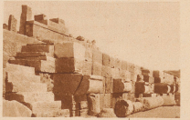
Die mit dem Saad ausgegrabene Hafenanlage. Man sieht die Treppe, die ins Wasser hinabführt, und die Vorposten, an denen die Schiffe befestigt wurden