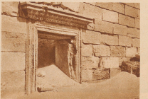
Ein kunstvolles Portal, durch das der Wüstensand strömt