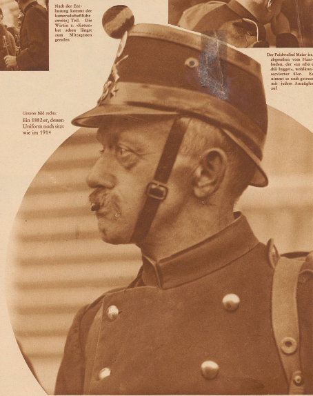
Unser Bild zeigt: Ein 1882 er, dessen Uniform noch immer wie im 1914