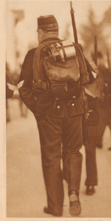
Die Entlassung ist überstanden. Der Landsturmsmeister darf seine Anwesenheit als Privatgenosse mit nach Hause nehmen