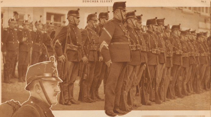
Ein historischer Moment, den jeder Wehrmann einmal erleben wird: Zum letztenmal erweist die Kommando: «Achtung — rechts!»

Am Ende jeden Jahres werden in der Eidgenossenschaft an die 10 000 Mann, unter Verdankung der geleisteten Dienste, aus der Wehrpflicht entlassen. Sie haben ihre Pflicht dem Vaterland gegenüber erfüllt. Jeder Abschied weckt wehmütige Gedanken. Der entlassene Landsturmsmann sträubt sich dagegen, nicht mehr wehrfähig zu gelten, weil er nun 48 Jahre alt geworden ist. Heimlich findet er, daß er es eigentlich noch mit jedem Jungen aufnehmen könnte. — Die Freude, nochmals, zum letztenmal in Uniform, mit gleichaltrigen Militärkameraden zusammen zu sein, ist jedem am Entlassungstag vom Gesichte zu lesen. Viele sind miteinander in die Schule gegangen und alle im Krieg an der Grenze gestanden. Etwas weckt des andern Erinnerungen, und fröhliche Momente aus dem Aktivdienst leben wieder auf.