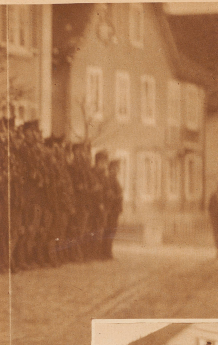
Ein Unteroffizier mit dem Namen auf: «Müller für Jahr» - Offizier - Oberfeld. Fritz! F! Die, gibst du Me, wie immer geht's