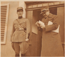
Das Entlassenerheinde Wehrmann und der Kreutzmeister besprechen sich vor dem Dorfplatz