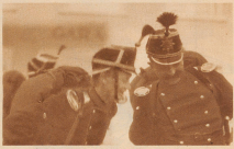
«Ja, der Herr Kapuziner hat nicht verzögert, nur verlangt jetzt im Nichts. Es müssen...»