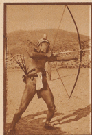
Pfeil und Bogen in der Hand des Goajira Indianer und tödliche Waffen. Zum Schlagen gegen die rückwärts gerichtete Wunde wird um die linke Handgelenk ein Lederriemen befestigt, um die Wunde zu decken. Pfeile sind alle vergiftet.