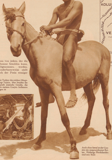
Auch ohne Sattel ist der Goajiro ein ausgezeichneter Reiter. Praktische Reitbrillen sind sein Stolz.