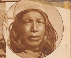
Das Gesicht dieser alten Frau erinnert stark an den Typus der nordamerikanischen Indianer, mit denen die Goajira aber sonst nichts gemein haben.

Umhang von Ziegen und Schafen stehen vorbei. Weiber, bunte Tücher um die Stirn gewickelt, Wangen und Nase rotbraun bemalt, füllen Tonkrüge mit dem unentbehrlichen Nahl oder waschen ihre wunden Glieder. Bewegungslos sitzt ein nackter Hängling auf einem schneeweißen Pferd. Mit lossem Blick, dem steten kantigen, schmalen Züge und die scharfe Adernasse etwas Wildes, Gebieterisches gibt, mustert er die Arbeit der Untergebenen. Es ist ein buntes, malerisches Treiben. Bilder von Oasen der arabischen Wüste tauchen in der Erinnerung auf.