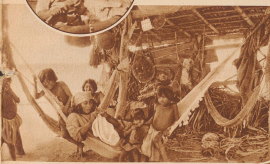
Blick ins Innere einer Goajira-Hütte. Zur Trockenzeit, wo Feuerstellen von über 60 Grad Celsius keine Schmelze und kein Wasser mehr bilden können, stehen die Bewohner in der Hitze und kochen. Die Wälder sind kahl, manchmal sogar ungewöhnlich kalt.