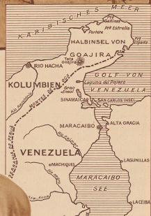
Kartenkarte der Goajira Halbinsel im äußersten Norden von Venezuela und Kolumbien.

nach Schönheit, sondern eher nach dem Stande und Reichtum der Frau. Eheschließungen sind einfach. Ist die Frau untreu, so kann sie nach Belieben geschickt werden und die Eltern müssen ihrem Manne die bezahlte Kaufsumme zurückerstatten. Das Recht über die Kinder steht immer der Mutter zu. «Der Sohn meiner Schwester ist bestimmt mein Neffe», sagen sie; oder Sohn meines Bruders dagegen, muß zuerst bewiesen werden.