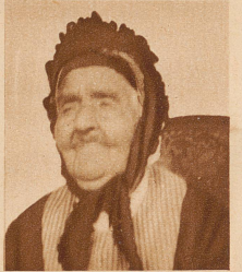
Das «Müetti Herzig», dessen hundertster Geburtstag im Oktober in Langenthal gefeiert wurde, ist vor einigen Tagen gestorben