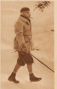
Der frühere französische Ministerpräsident André Tardieu erholt sich gegenwärtig in St. Moritz von den Staatsgeschäften