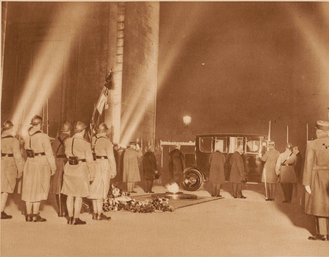
Mit großem Pomp wurden in Paris die Beisetzungsfestlichkeiten für Marschall Joffre durchgeführt. Der Sarg vor dem Grabe des unbekanntes Soldaten unter dem Arc de Triomphe