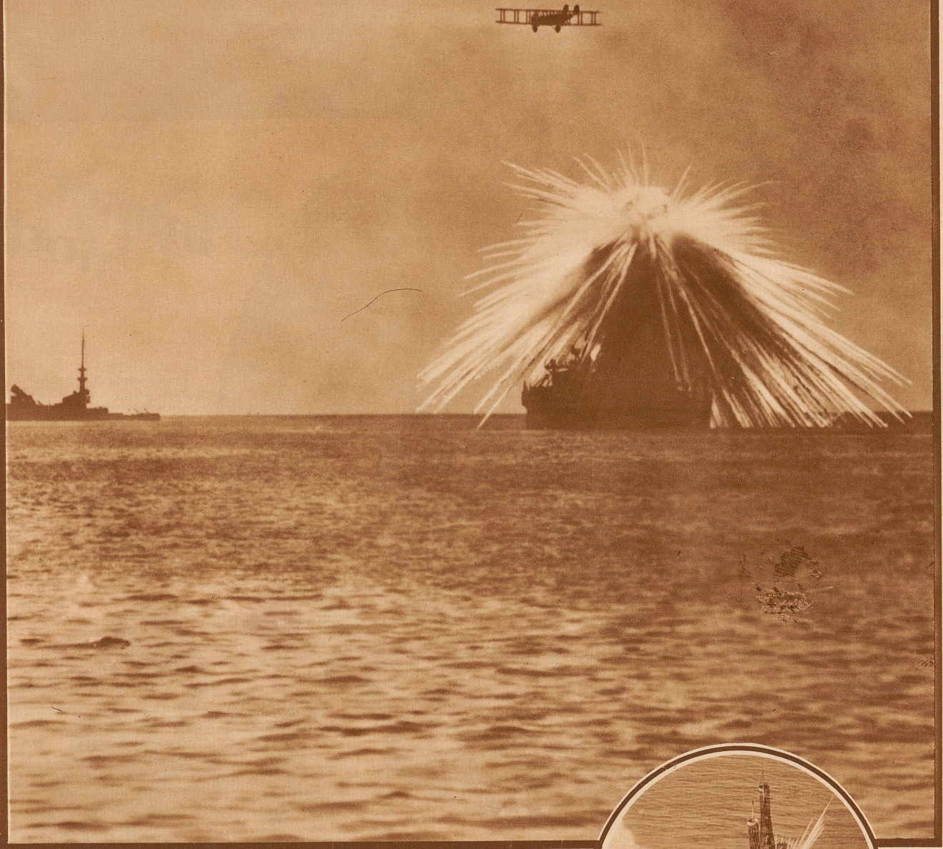
Explosion einer Phosphorbombe in den Masten

Der gefährlichste Gegner für die Flotte ist heute das Flugzeug. Zum erfolgreichen Angriff auf eine Wasserfläche von zehn Quadratkilometer werden 720 Tonnen Bomben berechnet, die von 480 Flugzeugen getragen werden können. Um also eine Fläche wie die der Straße von Gibraltar wirksam mit Bomben zu belegen, genügen 110 Flugzeuge. Da die Treffsicherheit aus einer Höhe von 5000 bis