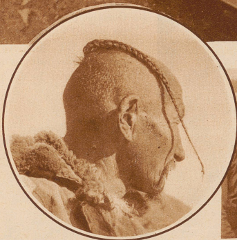
Das ist ein alter bezopfter Bauer aus dem Altai-Gebirge. Das Bild ist an einem Sonntag gemacht worden und da hat er seinen Zopf besonders schön geflochten