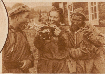
So etwas haben die Beiden in ihrem ganzen Leben noch nicht gesehen: einen Photo-Apparat. Eine junge Lehrerin aus dem Norden hat nämlich eine Wanderung durch ihr Gebirge gemacht. Sie hat bei ihnen übernachtet und essen dürfen und jetzt zeigt sie ihnen dafür ihren feinen Apparat. Der eine hat noch ein wenig Angst und schaut sich die Sache nur von ferne an, — aber dem anderen gefällt sie schon ganz gut, vielleicht wird er es bald selbst probieren

Hier ist eine ABC-Schule für die Altai-Frauen. Keine ist zu alt, um noch mitzulernen. Und alle tun es gerne und sind eifrig bei der Sache, auch die, die ein Kindchen auf dem Schoß haben, das sie nicht allein zu Hause lassen wollten. Die Kinder dieser Frauen werden es einmal besser haben, denn jetzt werden dort unten Schulen gebaut und sie werden lernen können, solange sie noch klein sind