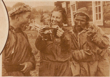
So etwas haben die Beiden in ihrem ganzen Leben noch nicht gesehen: einen Photo-Apparat. Eine junge Lehrerin aus dem Norden hat nämlich eine Wanderung durch ihr Gebirge gemacht. Sie hat bei ihnen übernachtet und essen dürfen und jetzt zeigt sie ihnen dafür ihren feinen Apparat. Der eine hat noch ein wenig Angst und schaut sich die Sache nur von ferne an, — aber dem anderen gefällt sie schon ganz gut, vielleicht wird er es bald selbst probieren

Hier ist eine ABC-Schule für die Altai-Frauen. Keine ist zu alt, um noch mitzulernen. Und alle tun es gerne und sind eifrig bei der Sache, auch die, die ein Kindchen auf dem Schoß haben, das sie nicht allein zu Hause lassen wollten. Die Kinder dieser Frauen werden es einmal besser haben, denn jetzt werden dort unten Schulen gebaut und sie werden lernen können, solange sie noch klein sind