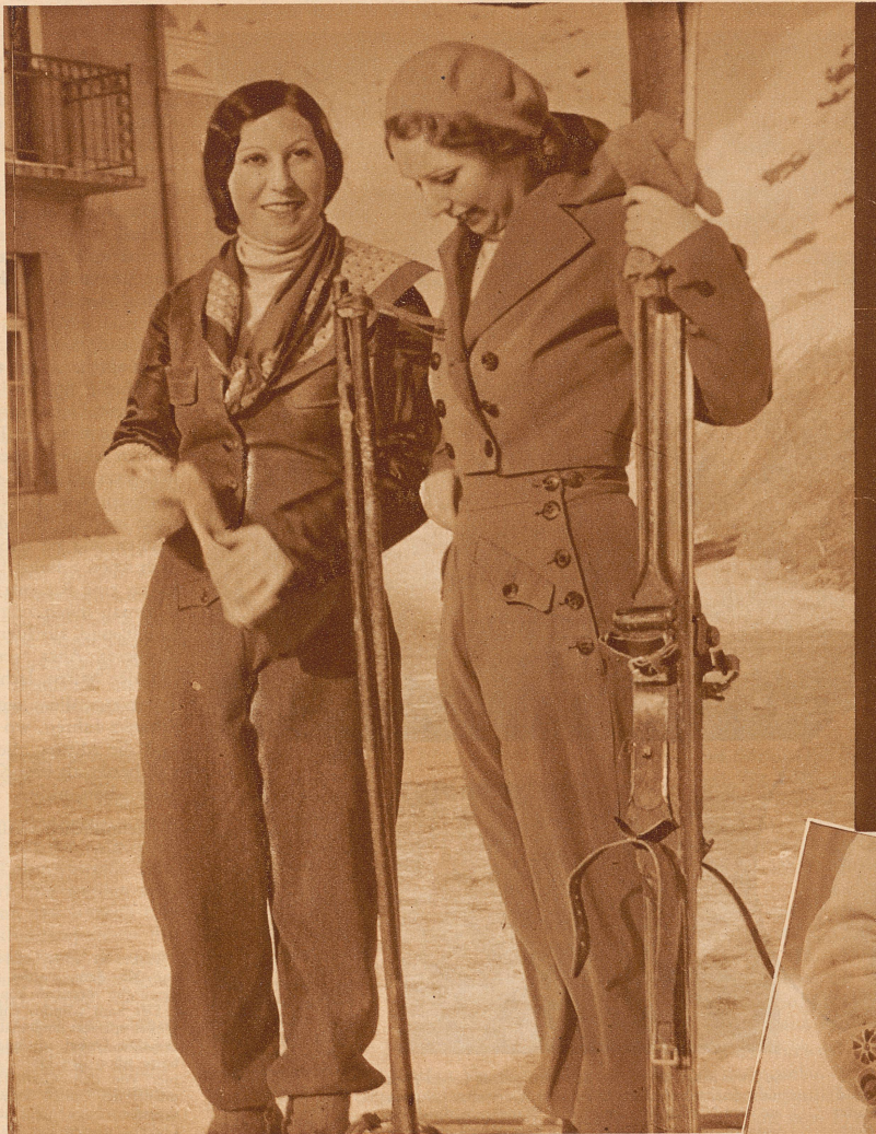
Zwei vorbildlich, praktische und gleichzeitig besonders fesche Ski-anzüge: links brauner Anzug mit gleicher Lederweste und rotem Seidentuch, rechts milchgrüner Anzug mit Ueberfallhose und Groomjacke, dazu gelber Pullover und Kappe. Ueberall kurze Jacken und enge Gürtung, — die Taille ist wieder Hauptsache geworden

Die Frauen wollen nun wieder in erster Linie schön sein, auch beim Sport. Und vor allem wollen sie «normal» sein. Das heißt hauptsächlich: Betonung der Taille. Daher die Gürtel und