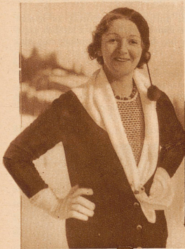
Die bekannte Filmschauspielerin Lya Mara propagiert für den Eislauf die Schwarz-Weiß-Mode