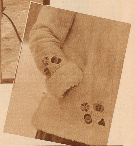
Ein hübsches Detail: Stickerei in farbiger Wolle auf einer weißen Lederjacke

Schön ist diese Abwechslung von Sport und Gesellschaftsleben, schön ist es, mit glühendem Gesicht aus der dämmernden Schneelandschaft wieder heimzukehren in die par-