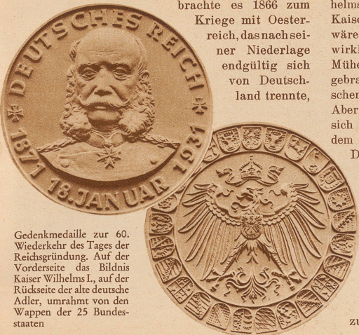
Gedenkmedaille zur 60. Wiederkehr des Tages der Reichsgründung. Auf der Vorderseite das Bildnis Kaiser Wilhelms I., auf der Rückseite der alte deutsche Adler, umrahmt von den Wappen der 25 Bundesstaaten

Aber die neue kaiserliche Majestät hatte ihren Zorn über Bismarck trotzdem noch nicht verwunden: als Wilhelm vom Podium der Fürsten herabstieg, da schritt er hoherhobenen Hauptes an seinem künftigen Reichskanzler vorbei, obwohl dieser allein auf dem freien Platze stand; den hinter ihm stehenden Generälen dagegen bot der Kaiser die Hand. — Erst nach mehreren Tagen kamen die gegenseitigen Beziehungen wieder ins alte Geleise.