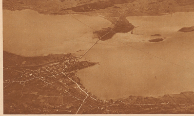
4 Die Brücke über den See und die berühmte Insel ...?