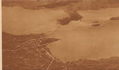
4 Die Brücke über den See und die berühmte Insel ...?