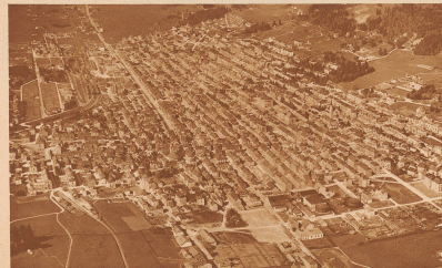
7 Dies ist jene Stadt der Schweiz, deren Grundriß an meisten Ähnlichkeit mit einer amerikanischen Stadt hat. Bitte, die Landschaft zu betrachten, in der sie liegt. Ähnliche Hügel über Meer wohl!