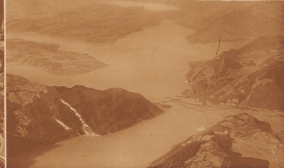
6 Es gibt nur einen oberst verzweigten See in der Schweiz. Das Tal rechts (Osten) führt zu einem bekannten Kurort.