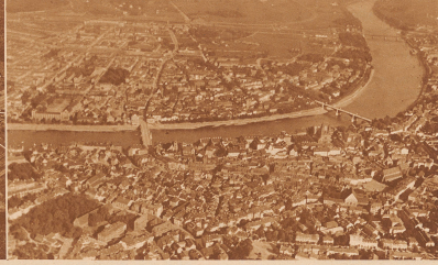
3 Sehen Sie das Rathaus mitten in der Altstadt? Nuu!!