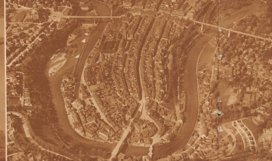
5 Der alte Teil einer Stadt auf einer hohen Halbinsel — wer kennt ihn nicht?