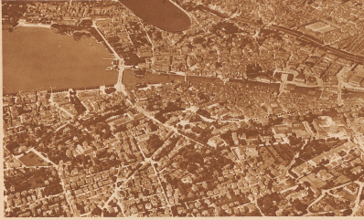
1 Oben ist Osten, rechts Norden. — Sogar scheint uns jeder Winkel überflüssig.

Verlag und Redaktion der «Zürcher Illustrierten»