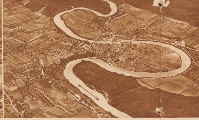
2 Ein reizendes Stückchen an den Windungen eines städtischen Flusses. Wie die Bildk. zeigt (s. Phil.). Es gibt in die Schweiz noch einen Ort denselben Namens, der ebenfalls so zu bezeichnen liegt.