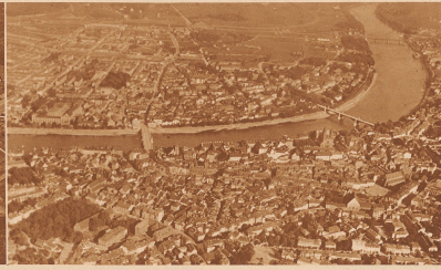
3 Sehen Sie das Rathaus mitten in der Altstadt? Nuu!!