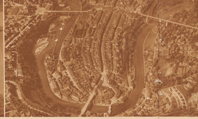
5 Der alte Teil einer Stadt auf einer hohen Halbinsel — wer kennt ihn nicht?