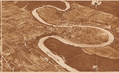
2 Ein reizendes Stückchen an den Windungen eines städtischen Flusses. Wie die Bildk. zeigt (s. Phil.). Es gibt in die Schweiz noch einen Ort denselben Namens, der ebenfalls so zu bezeichnen liegt.