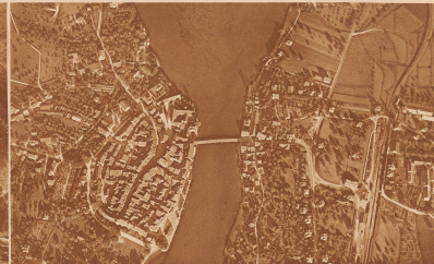
9 Senkrecht von oben ist dieses alte Stückchen aufgenommen. Das breite Wasser könnte ein See sein, das zu kennen man nicht verpflichtet ist. Aber den Stadt, der ein ihm herausschließt, sollte man kennen, dessen die Bildk. und das ganz alte Stadtbild.