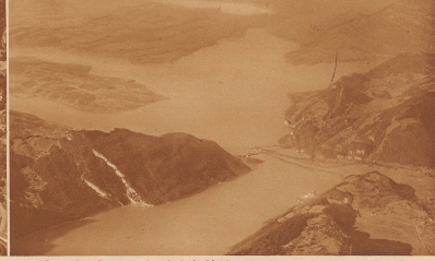
6 Es gibt nur einen oberst verzweigten See in der Schweiz. Das Tal rechts (Osten) führt zu einem bekannten Kurort.