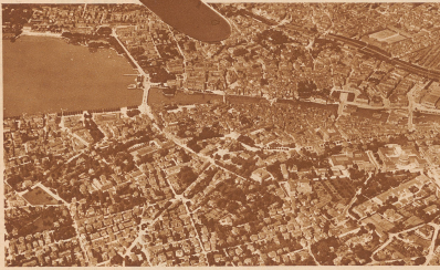
1 Oben ist Osten, rechts Norden. — Sogar scheint uns jeder Winkel überflüssig.

Verlag und Redaktion der «Zürcher Illustrierten»