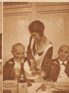
Als man zum letzten Male beisammen war, all man aus dem Gemeindefest der Oedmann