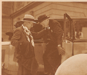
Vor 60 Jahren wie es «erregt» gegungen, wenn es schon Anzug gegeben hätte

Sonderausnahmen für die «Zürcher Illustrierte» von P. Senn