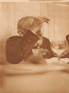
Nach Bern, Linsenkorn, gut Essen und Trinken, reichlich und für die Fremden aus Bern. Aber die Berner hält über seine Kameraden mit dem besten von uns. Man hat sich immer wieder