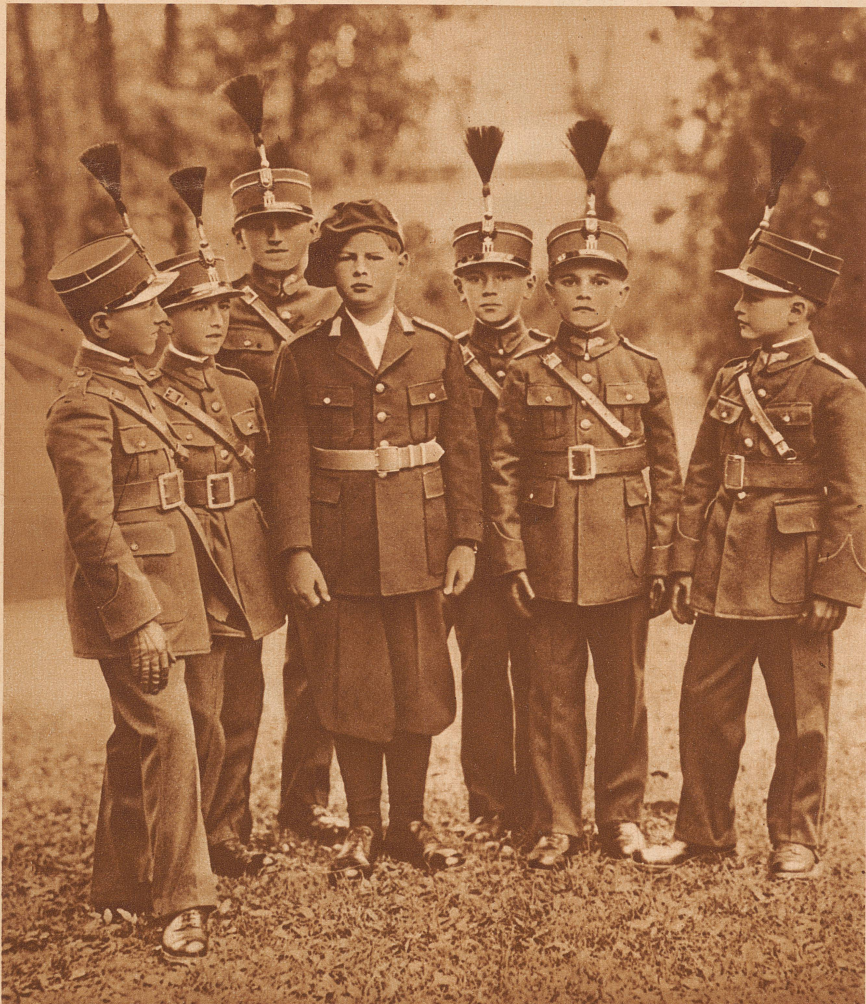
Der kleine Prinz Michael von Rumänien war ein ganzes Jahr lang König in seinem Land, bis sein Vater von Paris heimkam. Jetzt ist er wieder Kronprinz und muß warten, bis er groß ist, bevor er noch einmal König wird. Sein Bild kann man auf allen rumänischen Briefmarken sehen. Hier ist er zusammen mit seinen Klassenkameraden aus der Militärschule. Er muß riesig viel lernen, mehr als er gerne mag, denn er ist ein bißchen dick und faul und hochmütig

Hier ist das Hauptbureau der Kinderbank. Der zweite rechts oben ist der Direktor; er ist dreizehn Jahre alt und nimmt sein Amt sehr ernst und sorgt dafür, daß auch alle andern fest arbeiten. Hierher bringen die Kinder ihre Ersparnisse — Taschengeld und selbstverdientes Geld —, dann bekommen sie ein Bankbüchlein und eine Sparkasse. Hier können sie sich aber auch Geld ausborgen, wenn sie es gerade dringend brauchen und versprechen, es wieder zurückzahlen. Das ist doch praktisch?