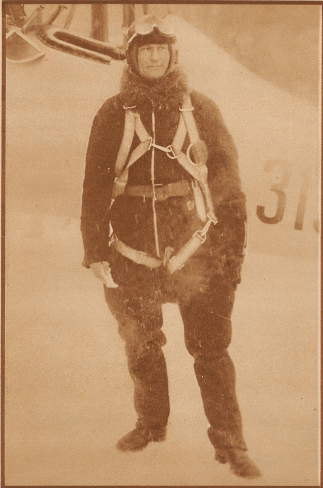
Der schwedische Fliegerhauptmann Einar Lundborg, der Retter Nobiles nach der Katastrophe der «Italia», verunglückte beim Einfliegen einer Maschine auf dem Flugplatz von Malmstät tötlich