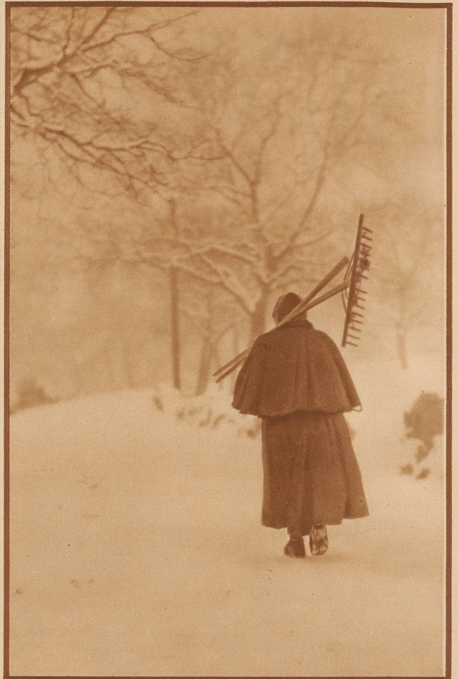
In Berlin hat man eigenartige Begriffe von der Winterarbeit der Bergbauern. Ein Berliner Photograph schreibt uns zu diesem Bild: «Aufstieg zur Weide um die verschneiten Felder freizulegen (Schweiz).» Ein Glück, daß nicht alle Photographen in Berlin «Oekonomieräte» sind!