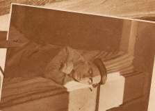
Morgens um 10 Uhr wachte eines die Sonne in der Hütte