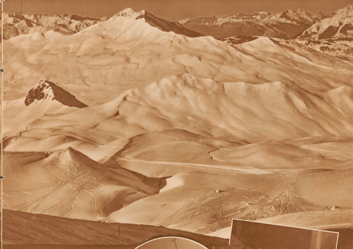
meter mit einer Höhendifferenz von 1600 Meter nach Küblis hinunter

Bei Nacht. Man liebt die Sonne, aber man schätzt sich nach wie die durch Hüttenne