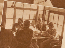
Brocken machen die Suppe dick! Auf der Wertsch der Parsennhütte misst man sich zur Abfahrt.