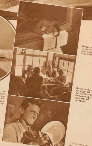
Morgens um 10 Uhr wachte eines die Sonne in der Hütte

mit ihm. Das Skibaby will einmal den Vorwand auf dem leuchtenden Kesselschichten ausprobieren