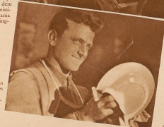
«Ein's geschmeckt? Na, also, dann — gute Abfahrt!»