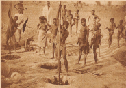
Die Fische streifen über Tümpel in den Ebenen.