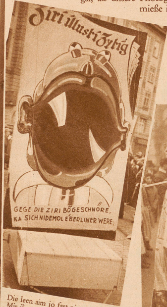
Die leen aim jo fast nimme dure Mit ihre große Zirischnüre

mieße in d'Luft hebe, sunscht hät's en Unglick kenne gä; und am Nohmittag sind d'Züg in großer Zahl uffmarschiert und hänn i dr Uffmachig, uff de Latärne und uff de Zeedel e so viel Gaischt, Witz und Humor bikun-