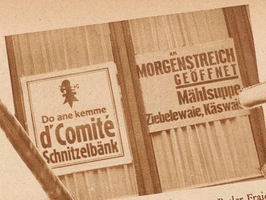
Das macht e jedem Basler Fraid, Au wenn er trait kai Fasnachtsglaid.

det, aß jedem Fasnächtler s' Härz im Lyb het mieße lache, sogar dr «Zircher Illustrierte», die zum Zaiche, aß si Spaß verstoht, e baar giftige Vårs und Bilder grad si beträffend, vereffentlicht. Me ka jo immer ebbis Nejs lehre, au wenn me nur vo Ziri isch.