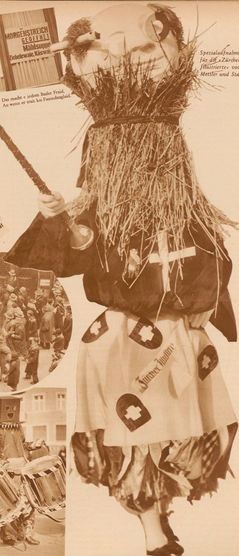
Spezialaufnahmen für die «Zircher Illustrierte» von Mettler und Staub