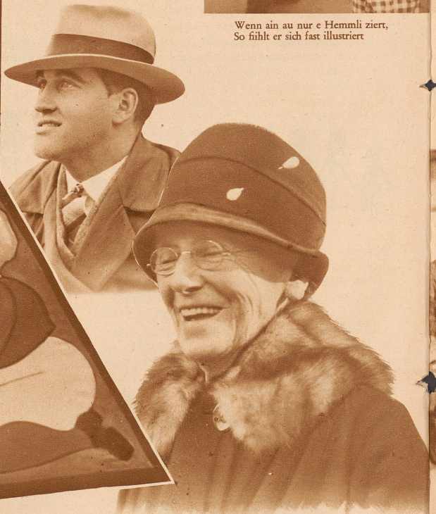
Ob jung, ob alt, ob glatt, verrunzlet, Me liest d'Latärnevärs und schmunzlet