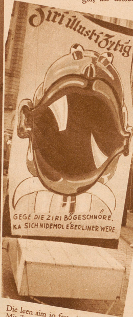
Die leen aim jo fast nimme dure Mit ihre große Zirrischnure

Wo dr Barometer am Sundig z'Obe e gwaltige Gump nach obe gmacht het, hämmer alli gwist, as es e scheeni Fasnecht gä werdi. Und scheen isch si worde. Am Morgestraich isch uff em Märt e so ne Druggete gsi, as unsere Photograph syni Blitzlichtbombe het mieße in d'Luft hebe, sunscht hät's en Unglick kenne gä; und am Nohmittag sind d'Züg in großer Zahl uffmarschiert und hänn i dr Uffmachig, uff de Latärne und uff de Zeedel e so viel Gaischt, Witz und Humor bikun-