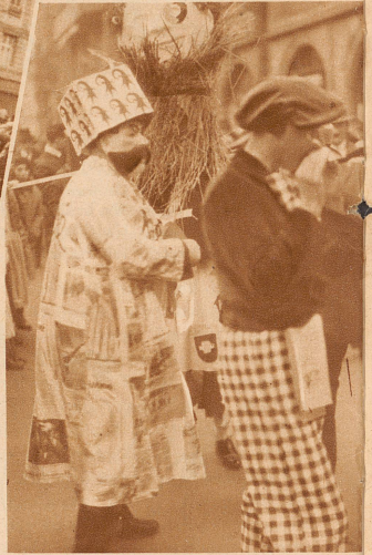
Wenn ain au nur e Hemmli ziert, So fihlt er sich fast illustriert