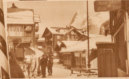
Blick in die Wengener Dorfstraße: Ein Chalet am anderen und gleich dahinter die Gipfel!

Auch die soziale Nahrung in Wengen vorfinden möchte. Für die berühmten Besucher eine English church und ein ländlicher Reverend zur Verfügung.