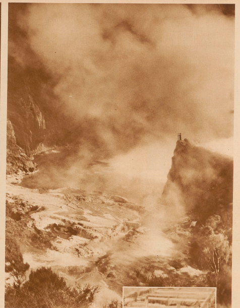
Der berühmte «Grande Calderon» auf der Nordseite von Neuseeland, einer der größten der gefährlichsten Schlammströme, diese entstehen durch die Verengung mehrerer Ausbruchskanäle kleinerer Vulkankegel; sie sind ihrer Chutten wegen für die Lebenswelt unanbar und hüllen die ganze Gegend in feuchtheiße Wolken ein.