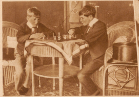
Am Tage schützelte, abends Schachspielen! Ebenso hingebend wie an den Sport sind die Engländer an diesem nachdrücklichen Spiel, zu dem ihre festen Kräfte englischen Köpfe so gut passen. Ihr geliebter Zylinderhut verläßt sie auch hier nicht.

Geldbeutel, demerallreicher ist, was sie bezahlen können. Sie hatten die Schweiz schon entdeckt und geliebt, lange bevor heroische Berglandschaften und Wintersports große Mode waren und es waren Engländer, die unter unermüdlicher Mühsal und Geduld als erste das Matterhorn bezwangen. Und nun kommt jahraus, jahrein ihre gütige und finanzielle Elite und bemächtigt sich mit dem ruhigen Stolz des Bestehenden unserer schönsten Plätze. Sie tun bei uns so ungefähr das, was sie auf unserem ganzen Planeten tun und