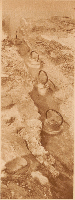
Die Maori-Frauen auf Neuseeland stellen ihre Kochtöpfe in die heißen Quellen; nach kurzer Zeit können sie ihr garkochtes Mittagessen herausholen.