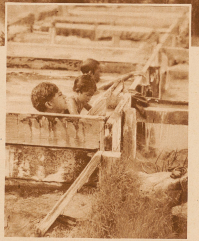
Eine wichtige Seite haben alle diese gefährlichen Schlammströme doch: der etwas abgekühlte Schlamm ist ein wunderbares Düngemittel und Vorbesengungsmittel. Die Maori-Jugend nimmt mit Wasser die giftigen Schlammbecken, — ein Vergnügen, das in Europa ein kleines Vermögen kosten würde. (Die Maori sind die dunklen Ureinwohner von Neuseeland.)

Ein furchtbares Erdbeben hat die Insel Neuseeland heimgesucht, dem vor wenigen Tagen ein zarterer, noch stärkeres gefolgt ist. Seit Menschengebären häuften sich hier die Naturkatastrophen. Aber auch in ruhigen Zeiten, wenn die großen Lavakrater still sind und die Erde sich nicht rührt, erschauern jene Zonen der immer brodelnden und rauchenden Schlammvulkanen an die verderblichen und gefährlichen, nie schlammenden Kräfte im glühend-heissen Innern der Erde.