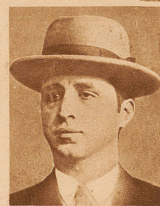
Rechts: Die beiden Hauptattentäter.