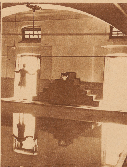
In dem Nehru-Palast, dem schönsten Privathaus von Allahabad: die Schwimmhalle, die er vor 35 Jahren seinen Kindern errichten ließ. Ein indischer Fürst kann keine schönere haben