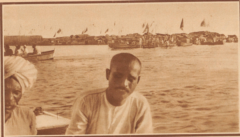
Hier, am Zusammenfluß der beiden heiligen Ströme Ganges und Jumna, wurde am 6. Februar 1931 Pandit Motilal Nehru bestattet. Dem Leichenzug folgten 60 000 Menschen; denn ist Gandhi die Seele, so war Nehru der Kopf der revolutionären Bewegung des jungen Indien. — Dies ist übrigens eine Aufnahme, die trotz des strengsten Verbores, an dieser Stelle zu photographieren, geheim hergestellt wurde

Auf der Veranda des Hauses empfing mich der Präsident. Man sah ihm nicht an, daß sein Sohn vor wenigen Tagen verhaftet wurde und daß ihn selbst die Last ungeheurer Arbeit und die Führung eines Kampfes von Weltbedeutung bedrückten. Es war ein ruhiger, selbstsicherer Mann, der vor mir stand, fast heiter; jedenfalls ließ ihn eine weltgewandte Liebeshwürdigkeit so erscheinen. — Auf dieser Veranda stand auch sein kleiner Schreibtisch; einige Zeitungen darauf und Papiere, zudem eine Reihe kleiner Gegenstände, die wenig zu einem Programm des Boykotts europäischer Waren zu passen schienen, u. a. eine Reiseuhr in aufgeklappten Lederetui. — Als ich eintrat, schickte Nehru seinen Sekretär fort. Er war seiner Worte sicher genug, um keinen Zeugen zu benötigen. Manches, was er mir sagte, mag durch die «Round Table»-Konferenz und die Entwicklung von zehn Monaten