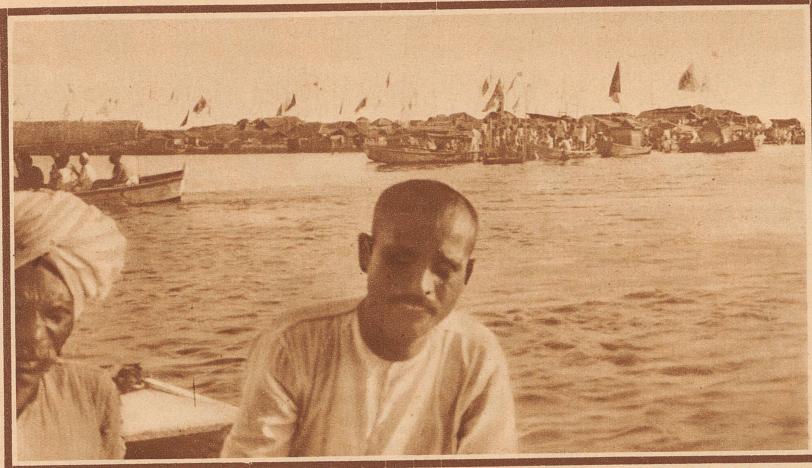
Hier, am Zusammenfluß der beiden heiligen Ströme Ganges und Jumna, wurde am 6. Februar 1931 Pandit Motilal Nehru bestattet. Dem Leichenzug folgten 60 000 Menschen; denn ist Gandhi die Seele, so war Nehru der Kopf der revolutionären Bewegung des jungen Indien. — Dies ist übrigens eine Aufnahme, die trotz des strengsten Verbores, an dieser Stelle zu photographieren, geheim hergestellt wurde

Auf der Veranda des Hauses empfing mich der Präsident. Man sah ihm nicht an, daß sein Sohn vor wenigen Tagen verhaftet wurde und daß ihn selbst die Last ungeheurer Arbeit und die Führung eines Kampfes von Weltbedeutung bedrückten. Es war ein ruhiger, selbstsicherer Mann, der vor mir stand, fast heiter; jedenfalls ließ ihn eine weltgewandte Liebeshwürdigkeit so erscheinen. — Auf dieser Veranda stand auch sein kleiner Schreibtisch; einige Zeitungen darauf und Papiere, zudem eine Reihe kleiner Gegenstände, die wenig zu einem Programm des Boykotts europäischer Waren zu passen schienen, u. a. eine Reiseuhr in aufgeklappten Lederetui. — Als ich eintrat, schickte Nehru seinen Sekretär fort. Er war seiner Worte sicher genug, um keinen Zeugen zu benötigen. Manches, was er mir sagte, mag durch die «Round Table»-Konferenz und die Entwicklung von zehn Monaten