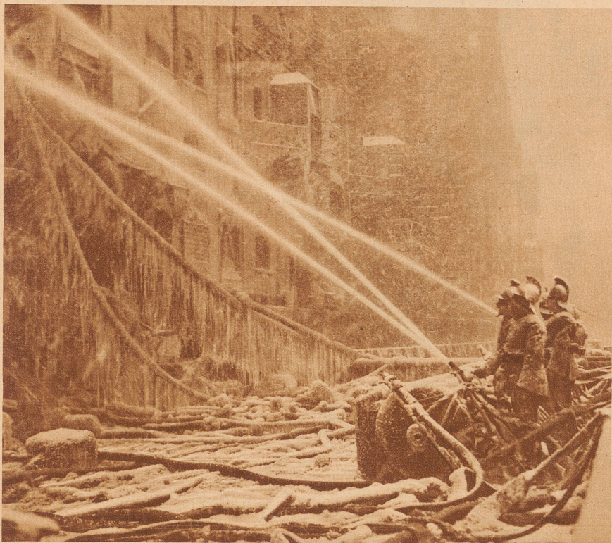
In London ist gerade während eines furchtbaren Schneesturms ein großes Feuer ausgebrochen; das Löschen war schrecklich schwer, weil das Wasser aus den Schläuchen gleich zu Eiszapfen wurde. 50 Stunden lang mußten die Feuerwehrleute arbeiten!

Der Vater sagt zu Hansli: «Wenn du zehn Jahre alt bist, schenke ich dir einen Kuchen mit zehn Lichtern. «Oh bitte», sagt Hansli ganz bescheiden, «kann ich nicht lieber ein Licht mit zehn Kuchen bekommen?»