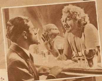
«Gefahr!» ruft es aus dieser Barszene