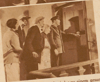
die Macht der Wissenschaft wieder zu einem gesunden Menschen werden

Der letzte Akt der durch die Krankheit entstandenen Tragödie: Die junge Frau des Arbeiters, die nicht wußte, daß ihr luetisches Kind noch zu heilen ist, hat versucht, sich und das Kind mit Gas zu vergiften; sie selbst ist nicht mehr zu retten, das Kind aber kann durch