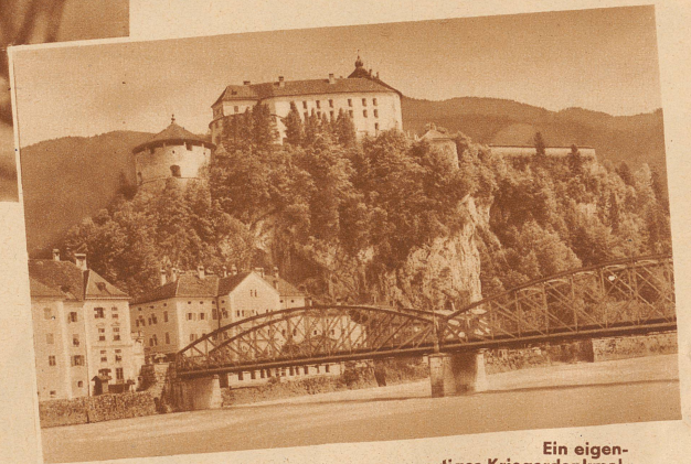
Ein eigenartiges Kriegerdenkmal.

Im runden Turm (links im Bilde) der Feste Geroldseck, am Städteingang von Kufstein im Tirol wird zurzeit eine Riesengorgel mit 1813 Pfeifen und 26 Registern zum Gedächtnis der im Weltkrieg gefallenen Deutschen und Oesterreicher eingebaut. Der Ertrag der Konzerte, die außer im 1000 Personen fassenden Konzertsaal in kilometerweitem Umkreis gehört werden können, soll der Kriegsblindenfürsorge Deutschlands und Oesterreichs zugute kommen