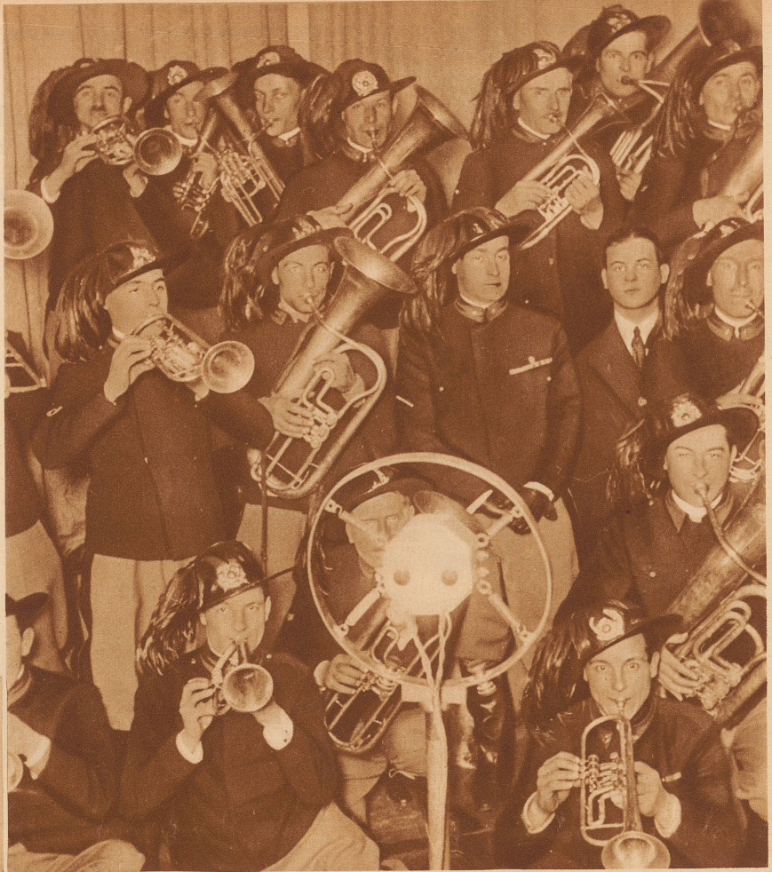
Bersaglieri-Kapellen spielen schneidige Märsche vor dem Mikrofon in Mailand

Man macht sich hierzulande meist falsche Vorstellungen vom italienischen Rundfunk. Die hervorragende Qualität der Sender, die gerade in der Schweiz ausgezeichnet empfangen werden können, läßt bei vielen die Meinung aufkommen, als marschiere der italienische Rundfunk in der ersten Reihe der Radiostaaen. Das ist nun doch nicht der Fall. Das Interesse der italienischen Bevölkerung für Radio ist noch sehr gering. Während man in der Schweiz Ende 1929 bereits 83 000 Konzessionäre zählte, bei 3,8 Millionen Einwohner, waren es in Italien nur 85 000 Konzessionäre bei 41 Millionen Einwohner. Zahlenmäßig steht Italien fast an letzter Stelle. Der italienische Rundfunk hat nur vier Programmformen, die ihm von Bedeutung schei-