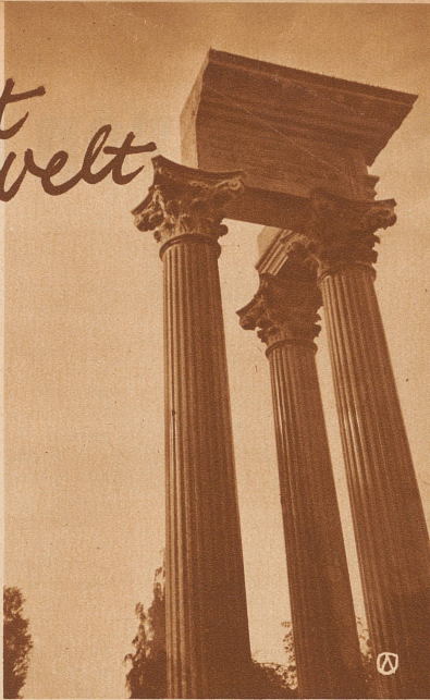
am dem Zentralfriedhof in Zürich.