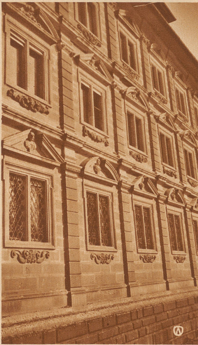
das Rabauis in Zürich.