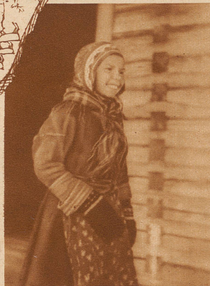
Laplandmädchen am Torneträsk-See