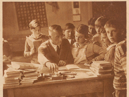
«Ist jemand von euch mit einer Note nicht einverstanden oder glaubt er, er sei zu kurz gekommen, so soll er mir das Zeugnis zeigen», sagt der Lehrer. Die halbe Klasse steht darauf an Lehrers Pult. Jeder hofft, nachdem er seine Leistungen zu rechtfertigen suchte, auf entsprechende Korrektur

pädagogische Einrichtung sind. Und er ist froh, daß er jetzt nur noch dreimal im Jahre Noten zu machen braucht, statt viermal wie bisher. St.