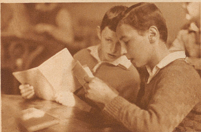
Eine gute Note ist nur halb so gut, wenn man sie nicht mit einer schlechten vergleichen kann, die einem andern gehört