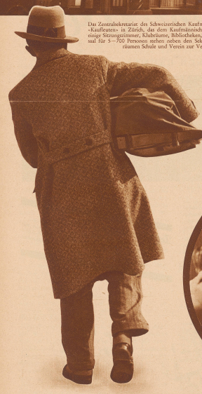
Wie leicht war noch das Schreibwerkzeug, als vor 70 Jahren der erste Verein junger Kaufleute gegründet wurde. Jetzt trägt der Lehrling auf dem Wege zur Diplombewerbsingen eine Schreibmaschine unter dem Arm.