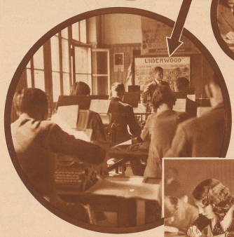
Rund 2500 kaufmännische Lehrlinge verlassen jährlich die Schulen mit dem Lehrlingsdiplom, das sie sich in den Lehrlingsvereinen des SKV erworben haben. Ohne Bekanntschaft der Schreibmaschine wird der werdende Kaufmann kaum Erfolg haben.

Von den verstorbenen Vorkämpfern des SKV trugen die Lehrlinge einen auf Erhaltung des gewerkschaftlichen Geistes. Die Kaufleute zahlen 1900 über 200.000 Franken an. Bild oben im Kreis: Der SKV verleiht über eine gewisse Zeit, die dem Lehrling in der Schweiz, in London, Mailand, Paris, Brüssel usw. Bild links: Junge Kaufleute lernen Diktieren der 100 Seiten, bei der Lehrveranstaltung werden ihnen täglich 120 Kassetten in deutscher Schreibschrift gegeben.