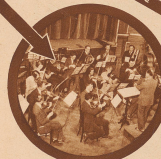
Die Kaufmännischen Vereine geben ihren Mitgliedern in besonderen Untergruppen Gelegenheit zur Pflege von Musik und Gesang, Sport und Spiel.