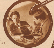
Der SKV zählt rund 3500 Jungmitglieder, die in neun regionalen Bundesorganisationen sind.

RECHTSABTEILUNG JUGENDRAT ENTWICKELUNG FORSCHUNG GEMEINSCHAFT ANGESTELLTENKREISE