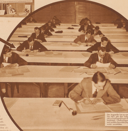
Der Angestellte hat nur ausgedient. Der SKV gibt ihm Gelegenheit, sich in Diplombewerbsingen für Chief-Bookhalter, Chief-Korrespondenten und perfekte Stralchlyographen weiter auszubilden.