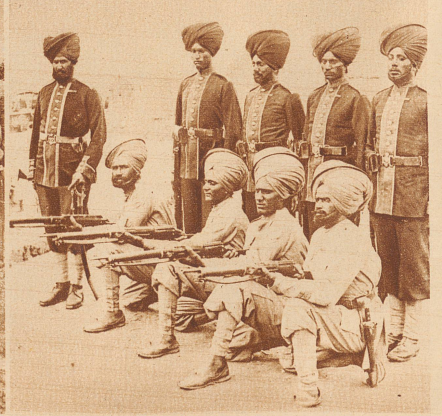
Ein großes Kontingent der englischen Streitkräfte bestand aus Indern, die man aus ihrer matts gelegenen Heimat zwangsweise herbeigeschafft hatte und die nun als Unterdrückte kämpfen mußten