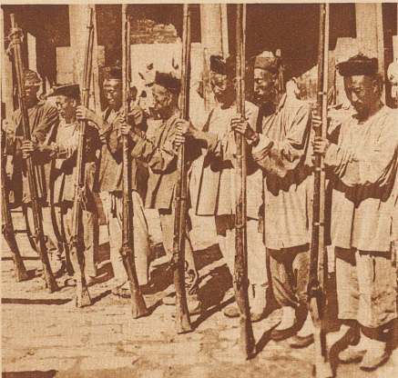
Boxersoldaten mit ihren riesigen vorsintflutlichen Gewehren, mit denen sie gegen die modernen Waffen der Europäer kaum etwas ausrichten konnten. Nicht die »besseren Nerven« haben in diesem Fall den Krieg entschieden, sondern die überragende Technik der Europäer