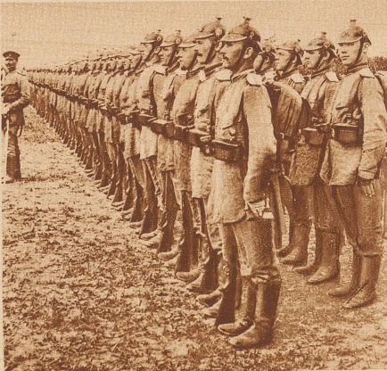
Deutsche Truppen vor dem Gefecht: Glänzend ausgerüstet, gut genährt, in der berühmten preussischen Disziplin gedrillt, waren sie trotz ihrer geringen Zahl den Soldaten des Vierhundertmillionsenreichs weit überlegen