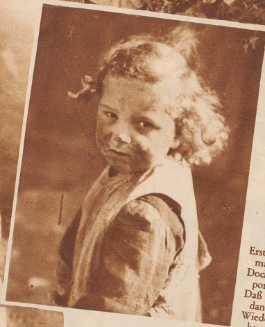
Erstes Lieb muß man verlieren. Doch man kann es porträtieren, Daß man später dann und wann Wiederum es sehen kann.