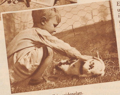
Häsleins Fell ist seidenglatt. Wie's selbst Teddibär nicht hat; Und es strahlt der kleine Mann, Weil er 's Häslein streicheln kann.