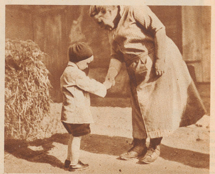
«Abschied» welch ein traurig Wort, Seht, nun muß der Arme fort, Tapfer kämpft der kleine Mann, Gegen seine Tränlein an.