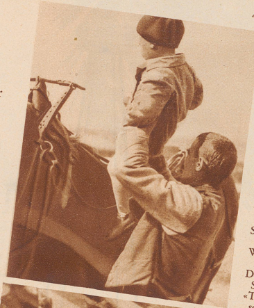
Stolz ist jeder Reitermann Wenn er einmal reiten kann. Doch ein inn'res Stimmlein spricht: «Traue der Geschichte nicht!»