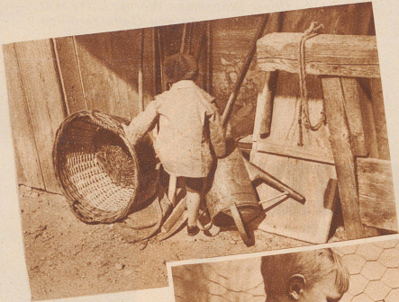
In den Winkeln und den Ecken, Bei den Körben und den Stecken, Suchen, Schnüffeln ohne Ziel, Ist ihm fast das lieb- ste Spiel.