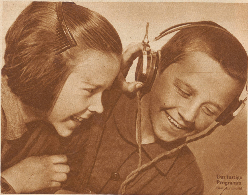
Das lustige Programm

Das schweizerische Radiowesen ist seit dem Frühjahr 1931 in verheißungsvollem Aufstieg begriffen. Das Rundspruch-Sendernetz wurde ausgebaut und das gesamte Radiowesen neu organisiert. — Die gebirgige Natur des Landes und die sprachlichen Verhältnisse der Schweiz erschweren einen systematischen Ausbau des Sendernetzes. Die Landessender Beromünster und Sottens entstanden als die Grundpfeiler des schweizerischen Rundspruchsendernetzes nördlich der Alpen. — Während der westschweizerische Landessender in Sottens in Betrieb gegeben wurde, ist nun auch Beromünster eröffnet worden. Der deutschschweizerische Landessender steht mit seinen zwei schlanken 125 m hohen Antennentürmen und dem Stationsgebäude auf der Hügelkuppe zwischen Sempacher- und Baldegersee oberhalb Münster. Er ist ein Wunderwerk der Technik und wird bald in ganz Europa Zeugnis ablegen von deutschschweizerischer Eigenart und Kultur.