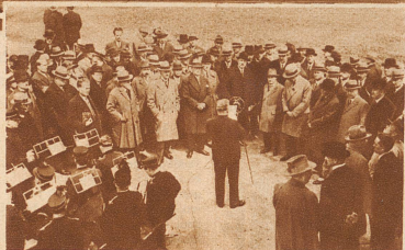
Mit Reden und Musikvorträgen vor dem Mikrophon wurde am 3. April der westschweizerische Landessender, der zweite Grundpfeiler des schweizerischen Rundspruchsendernetzes, in Sottens eröffnet