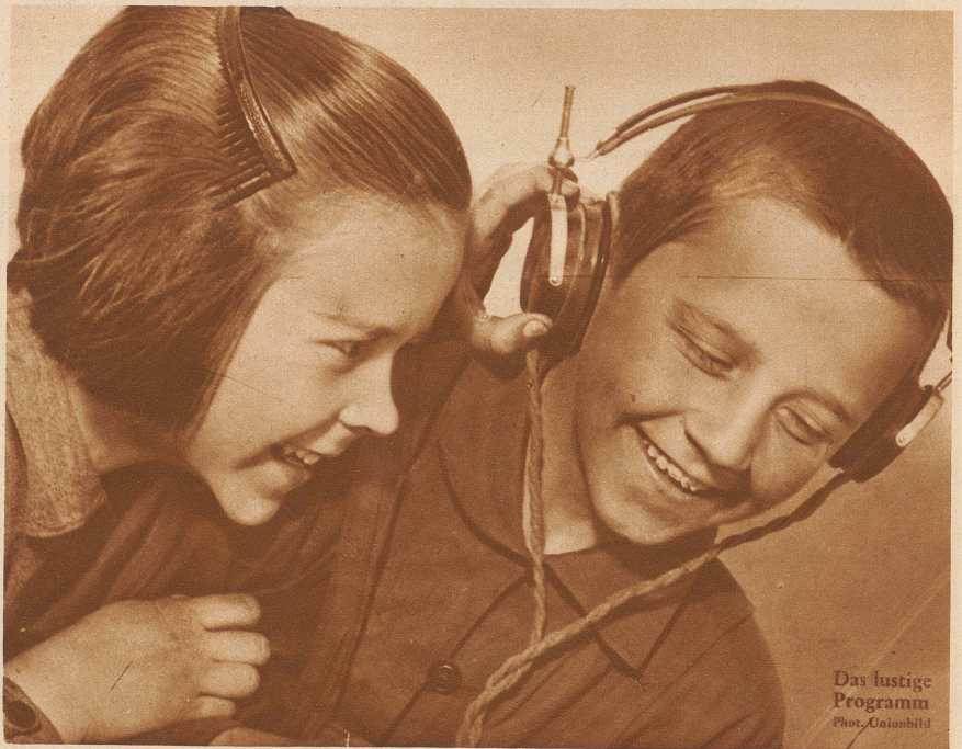
Das lustige Programm

Das schweizerische Radiowesen ist seit dem Frühjahr 1931 in verheißungsvollem Aufstieg begriffen. Das Rundspruch-Sendernetz wurde ausgebaut und das gesamte Radiowesen neu organisiert. — Die gebirgige Natur des Landes und die sprachlichen Verhältnisse der Schweiz erschweren einen systematischen Ausbau des Sendernetzes. Die Landessender Beromünster und Sottens entstanden als die Grundpfeiler des schweizerischen Rundspruchsendernetzes nördlich der Alpen. — Während der westschweizerische Landessender in Sottens in Betrieb gegeben wurde, ist nun auch Beromünster eröffnet worden. Der deutschschweizerische Landessender steht mit seinen zwei schlanken 125 m hohen Antennentürmen und dem Stationsgebäude auf der Hügelkuppe zwischen Sempacher- und Baldegersee oberhalb Münster. Er ist ein Wunderwerk der Technik und wird bald in ganz Europa Zeugnis ablegen von deutschschweizerischer Eigenart und Kultur.