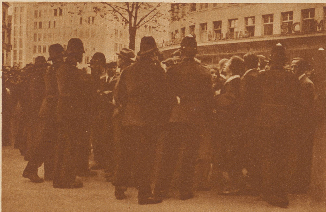
Der Streik im Schneidergewerbe in Zürich, der schon sieben Wochen mit mehr oder weniger Erfolg andauert, führt da und dort zu Massenansammlungen, so daß die Polizei zur Aufrechterhaltung des Verkehrs gezwungen ist, einzuschreiten