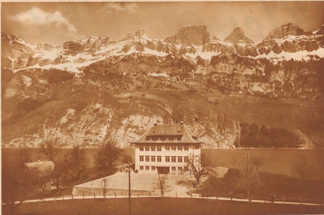
Wer möchte da nicht noch einmal Schüler werden? Das neue Schulhaus in Mols am Walensee. Anschauungsmaterial für den Unterricht in Geographic und Geologie liegt vor den Fenstern