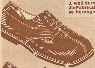
Boxcalf und Lack Nr. 18-29 9.60 bis 14.90