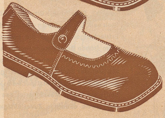
Boxcalf und Lack Nr. 18-29 10.90 bis 17.90

Daß der Prothos- Schuh aber nicht nur gesund, sondern auch schön ist, be- weisen Ihnen gerne unverbindlich die Schuhgeschäfte mit dem Prothos-Zeichen