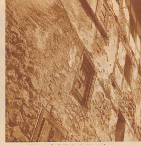
Wie die meisten Gassen eines alten Mannes sehen macht der steile Felsen aus verwittertem, mit ausgefallenen Kieselwerk und zerbrochenen Fensterscheiben ...

Ebenfalls vor 150 Jahren sprach man von Romanshorn bei Ulm, damals ein unbedeutendes Fischerdörfchen, das dem Fürstbist von St. Gallen gehörte und kaum 100 Einwohner zählte. Und heute? Heute