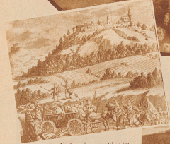
Auch heute noch sieht das Städtchen im wesentlichen gleich, wie es schon vor 192 Jahren auf seiner hohen Warte droben stand. Einzige bautechnische wesentliche Änderungen sind seitler hinzugekommen, sonst nichts.