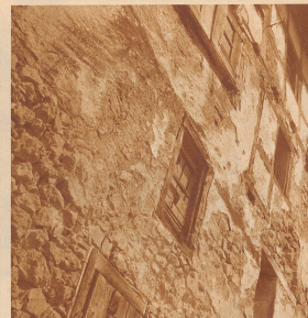
Wie die herrliche Gasse eines alten Mannes sehen mancher der stolzen Fronten aus, vorwiegend mit aufgestautem Kieselwerk und zerfetzten Fensterscheiben ...

wand ist ganz gewaltig — Wornaf aber beruhend diese Verschiebungen?