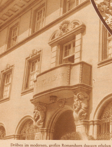
Drüben im modernen, großen Romanshorn dagegen erheben sich die steilen Fassaden seiner Geschickhaber und verfallen dem ehemaligen Fischerdörfchen bis heute ein stilles Aussehen

Jeder empfindet, der heute seinen Fuß in das sterbende Städtchen setzt. Ganz anders Romanshorn: an einer Stelle gelegen, die im modernen Verkehrsnetz von einstgigen Werten ist, hat dieses ehemalige arme Fischerdörfchen heute eine ganz gewaltige Bedeutung erlangt, und dementsprechend nimmt die Ortschaft zusehends einen städtischen Charakter an. Wohl hat der Weltkrieg