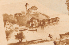
1811 umher. Alt-Romanshorn, vor 150 Jahren ein kleines Fischerdörfchen, mit kaum 100 Bewohnern, Vogelsitz des Fürstbistums von St. Gallen ...

ist folgendes: Etwa seit der französischen Revolution ist auch das ganze System des Verkehrs wesens einer grundlegenden Umgruppierung unterlegen. Viele Siedlungen, welche in mittelalterlichen Verkehrsnetz die wichtigsten Stellen einnahmen, stehen jetzt abseits der