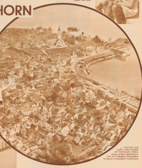
... und heute eine große, reiche Ortschaft mit bedeutender Hafenanlage, diejenige Lagerplätze, einer der wichtigsten Transitplätze im ganzen europäischen Verkehrsnetz