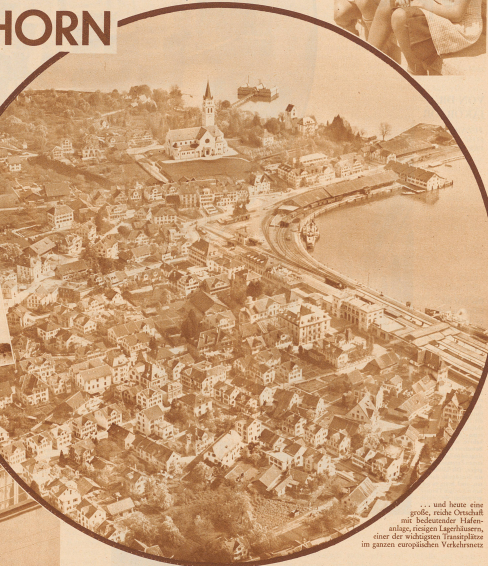
... und heute eine große, reiche Ortschaft mit beständiger Hafenszene, dessen Lagerhäuser, einer der wichtigsten Transitplätze im ganzen europäischen Verkehrsnetz

Jeder empfindet, der heute seinen Fuß in das sterbende Städtchen setzt.