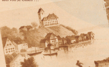
1811 umher. — Alt-Romanshorn, vor 150 Jahren ein kleines Fischerdörfchen, mit kaum 100 Bewohnern, Vogelsitz des Fürstbischofs von St. Gallen ...

ist folgendes: Etwa seit der französischen Revolution ist auch das ganze System des Verkehrs wesens einer grundlegenden Umgruppierung unterlegen. Viele Siedlungen, welche in mittelalterlichen Verkehrsnetz die wichtigsten Stellen einnahmen, stehen jetzt abseits der