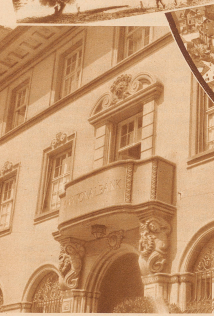
Drüben im modernen, großen Romanshorn dagegen erheben sich die stolzen Fassaden seiner Geschicklichen und verfallen dem ehemaligen fischerbäuerlichen Dörfchen ein stolzes Aussehen