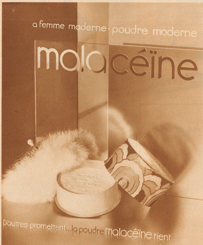
BILD-INSERAT IST DIE NACHHALTIGSTE WIRKUNG ZU EIGEN! VERLANGEN SIE VORSCHLÄGE! „ZÜRCHER ILLUSTRIRTE“