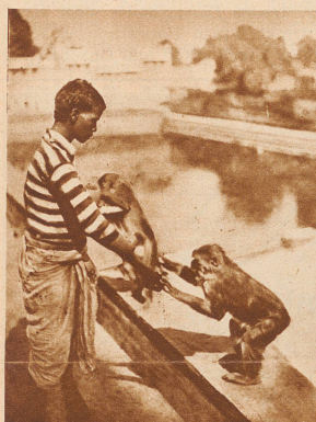
Der braune Junge und die Affen.

Herzlichen Gruß und Glückwunsch den Gewinnern vom Unggle Redakter.