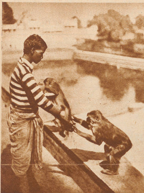
Der braune Junge und die Affen.

Herzlichen Gruß und Glückwunsch den Gewinnern vom Unggle Redakter.