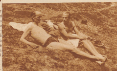
Die Menschen mit ihrem Ansat. In Piccard's Zelt in Obergurgel. Die beiden Piccard's sind links. Die beiden Mittelholzer sind rechts. Die beiden Piccard's sind links. Die beiden Mittelholzer sind rechts. Die beiden Piccard's sind links. Die beiden Mittelholzer sind rechts.