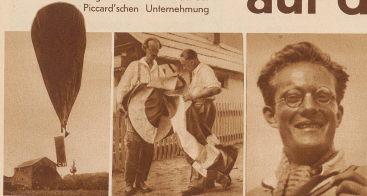
Der Ballon Piccards mit dem ihm die Stromleitung gleichgültig blieb nach dem Start in Andover. Der Ballon in nur zwei Teil mit Gas gefüllt. Beide wurden wieder durch die Anordnung des Gas-Kupfers ausgetrieben. Die Papierhülle des oberen Zylinders C.H.