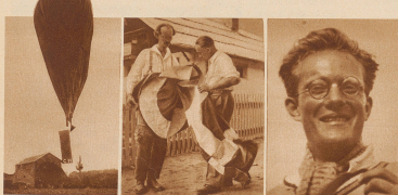
Der Ballon Piccards mit dem ihm die Stromleitung gleichgültig blieb nach dem Start in Andover. Der Ballon in nur zwei Teil mit Gas gefüllt. Beide wurden wieder durch die Anordnung des Gas-Kupfers ausgetrieben. Die Papierhülle des obersten Zylinders CE.