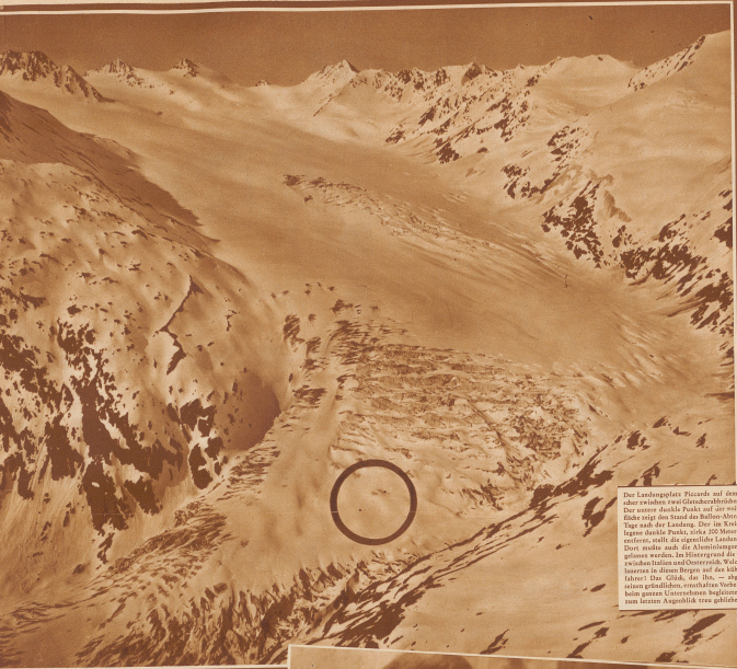
Die Landungsplätze Piccards auf den Gurgelgletschern zwischen Gurgelgletscher und Gurgelgletscher. Die weitere Ansicht zeigt die Ballon-Abstiegsstelle im Bild rechts von Piccard. Der im Kreis gezeichnete Ort ist die Landungsstelle. Der im Kreis gezeichnete Ort ist die Landungsstelle. Dort wurde auch die Altimeterstation errichtet. Zwischen Piccard und Gurgelgletscher in einem Bergpaß auf dem linken Gurgelgletscher. Die Höhe des Berges — Gurgelgletscher — ist durch einen Gurgelgletscher in dem Bild zum letzten Anstieg von Piccard gezeichnet.