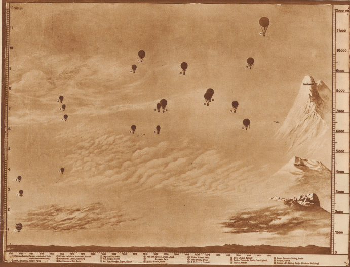
Historisch bemerkenswerte Ballonfahrten von Piccard. Die vorgeschaltete Skala in Verbindung mit der nach rechts verzeichneten Fortschritts der Luftfahrt mit Ballon von Filize de Reuter im Jahre 1780 bis Beginn 1955. Die Zahlen rechts im Bild bezeichnen die erreichten Höhen, die unten im Bild sind Jahreszahlen bis 1900. Steiler gehen einem amerikanischen Aeronaute ein Aufstieg in die Höhe von 12.000 Metern, von dem er aber nicht lebend zurückkehrte. Den Nummern der Ballons sind die Namen der jeweiligen Piloten beigelegt.