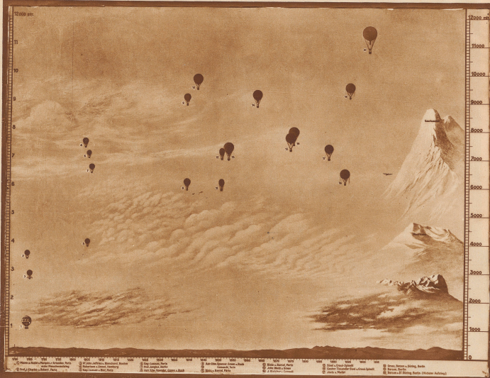
Historisch bemerkenswerte Ballonfahrten von Piccard. Die vorgeschaltete Skala in Verbindung mit der nach rechts verzeichneten der Fortschritte der Luftfahrt mit Ballon von Pilzre im Jahre 1780 bis heute 1955. Die Zahlen rechts im Bild bezeichnen die erreichten Höhen, die unten im Bild sind Jahreszahlen bis 1900. Später gelang einem amerikanischen Aeronaute ein Aufstieg in die Höhe von 12 000 Metern, von dem er aber nicht lebend zurückkehrte. Den Nummern der Ballons sind die Namen der jeweiligen Piloten beigelegt.