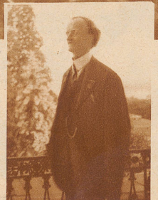
Bild rechts: Piccard, mehrere Male herausgerufen, begrüßt die enthusiastische Menge von der Terrasse des Hotel Baur au Lac aus

Die «Zürcher Illustrierte» erscheint Freitags • Schweizer Abonnementspreise: Vierteljährlich Fr. 3.30, halbjährlich Fr. 6.30, jährlich Fr. 12.—. Bei der Post 30 Cts. mehr. Postscheck-Konto für Abonnements: Zürich VIII 3790 • Auslands-Abonnementspreise: Beim Versand als Drucksache: Vierteljährlich Fr. 4.50 bzw. Fr. 5.25, halbjährlich Fr. 8.65 bzw. Fr. 10.20, jährlich Fr. 16.70 bzw. Fr. 19.80. In den Ländern des Weltpostvereins bei Bestellung am Postschalter etwas billiger. Insertionspreise: Die einspaltige Millimeterzeile Fr. —.60, fürs Ausland Fr. —.75; bei Platzvorschrift Fr. —.75, fürs Ausland Fr. 1.—. Schluß der Inseraten-Aannahme: 14 Tage vor Erscheinen. Postscheck-Konto für Inserate: Zürich VIII 15769