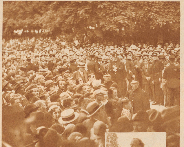
Auch vor dem Hotel Baur au Lac, wo Piccard abstieg und zu seinen Ehren ein offizieller Empfang stattfand, wurde der Forscher Gegenstand begeisterter Kundgebungen