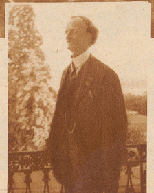
Bild rechts: Piccard, mehrere Male herausgerufen, begrüßt die enthusiastische Menge von der Terrasse des Hotel Baur au Lac aus

Die «Zürcher Illustrierte» erscheint Freitags • Schweizer Abonnementspreise: Vierteljährlich Fr. 3.30, halbjährlich Fr. 6.30, jährlich Fr. 12.—. Bei der Post 30 Cts. mehr. Postcheck-Konto für Abonnements: Zürich VIII 3790 • Auslands-Abonnementspreise: Beim Versand als Drucksache: Vierteljährlich Fr. 4.50 bzw. Fr. 5.25, halbjährlich Fr. 8.65 bzw. Fr. 10.20, jährlich Fr. 16.70 bzw. Fr. 19.80. In den Ländern des Weltpostvereins bei Bestellung am Postschalter etwas billiger. Insertionspreise: Die einspaltige Millimeterzeile Fr. —.60, fürs Ausland Fr. —.75; bei Platzvorschrift Fr. —.75, fürs Ausland Fr. 1.—. Schluß der Inseraten-Annahme: 14 Tage vor Erscheinen. Postcheck-Konto für Inserate: Zürich VIII 15769