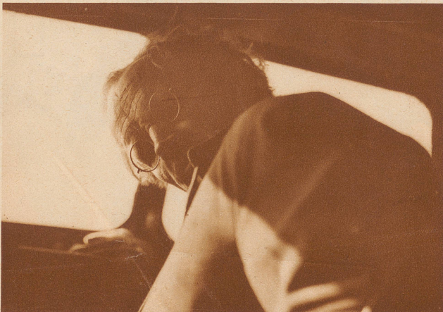
Piccard am Steuer des Flugzeuges, mit dem er von Augsburg nach Dübendorf flog