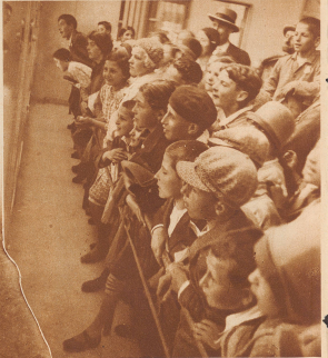
Es war verwunderlich, die kleinen Kinde haben kaum gelacht, auch wenn die Äußerlichkeiten noch so Kapriolen machten. — In der ersten Nacht, aber die ganze große Fahrt der Reise hat sie so verzaubert und erzaubert, daß sie gar nicht zum Lachen kamen