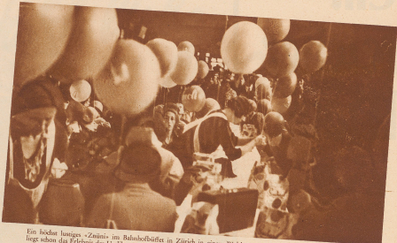
Ein heftiges Festzug «Zinnis» im Bahnhofsplatz in Zürich in einem Wald von farbigen Ballons. Hinter den Kindern liegt schon die Erhebung des Letibergs mit der Bergspitze des Anzichers und der See bei den alten Eidgenossen im Landdomänen. Von kommt noch die große Ausfahrt und die wilden Tiere. Die Welt ist ein Zaubergarten