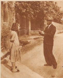
Dino ist der Lehrer von Dino am Vorabend der Reise. — Die Aufregung im Dorf ist groß. Schon im Winter begannen die Vorbereitungen, damals als er Laubblätter gesammelt hat, um das Reisegeld zusammenzubekommen. Er wollte aber nicht die Zeit zum reifen Ziel kam der Aufbruch in der «N. Z. Z.», um die Erklärung bereit zu stellen. «Alle quattro parano» sagt er, und steigt auf den Berg. Um wie viel länger hätte's besser sein können, wenn jedes Kind im Dorf. Sie waren dann auch alle zeitig zur Stelle

Ein initiativer Lehrer und eine Anzahl freundlicher Spender aus Zürich und andern Orten ermöglichten es der Schule von Dino, einem kleinen, armen Bergort bei Lugano, in zweijähriger Reise ein schönes Stück ihres Heimatlandes nördlich der Alpen kennen zu lernen. «Kennenlernen», das ist wohl zu viel gesagt, denn in zweijähriger Reise kann man eine Stadt wie Zürich nur flüchtig sich ansehen, aber für diese 64 Kinder im Alter von 8—14 Jahren aus Dino, von denen keines vorher jemals das große Loch im Berg passiert hatte, von denen einige sogar bei dieser Gelegenheit das erste Mal auf der Eisenbahn fuhren, bedeutete diese Schulfahrt ein großes Erlebnis, das Eindruck hinterließ, der nicht so rasch verblasen werden wird. Solche Schulfahrten unter kundiger Führung ist wohl der gründlichste Geographie- und Anschauungsunterricht, den man jungen Menschen zuteil werden lassen