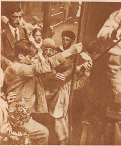
Der Zug zur Abreise in die Innerschweiz ist im Bahnhof Lugano eingetroffen. Die Kinder haben es eilig beim Einsteigen, um sich im Wagen einen Koffer zu machen. «Nur nicht drängeln», mahnt der Lehrer, «ein jedes wird einen Ausweisplatz erhalten»