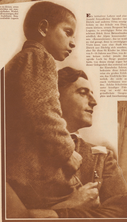
Dino ist ein kleines, armes Bauerndörfchen mit merkwürdigem abfallendem Hügel, hügellos im Norden, aber wenig fruchtbarer Berg- und nordöstlich Lugano.

Ein initiativer Lehrer und eine Anzahl freundlicher Spender aus Zürich und andern Orten ermöglichten es der Schule von Dino, einem kleinen, armen Bergort bei Lugano, in zweijähriger Reise ein schönes Stück ihres Heimatlandes nördlich der Alpen kennen zu lernen. «Kennenlernen», das ist wohl zu viel gesagt, denn in zweijähriger Reise kann man eine Stadt wie Zürich nur flüchtig sich ansehen, aber für diese 64 Kinder im Alter von 8—14 Jahren aus Dino, von denen keines vorher jemals das große Loch im Berg passiert hatte, von denen einige sogar bei dieser Gelegenheit das erste Mal auf der Eisenbahn fuhren, bedeutete diese Schulfahrt ein großes Erlebnis, das Eindruck hinterließ, der nicht so rasch verblasen werden wird. Solche Schulfahrten unter kundiger Führung ist wohl der gründlichste Geographie- und Anschauungsunterricht, den man jungen Menschen zuteil werden lassen